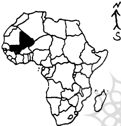
موقعیت کشور اسلامی مالی در غرب آفریقا

با پیروزی سونجاتا کیتا، وی امپراتوری مالی را که تمام طوایف «ماند» در آن متحد شده بودند، بنیان نهاد. جای او را فرزندش منسی (۱) اولی گرفت، او