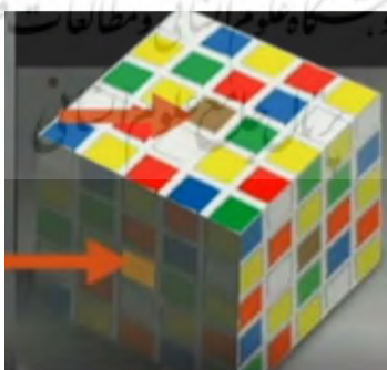
تصویر شماره ۲

مغز انسان در تشخیص امر صحیح در این دو مثال بازمی‌ماند. بر همین سیاق، انسان - در بسیاری از