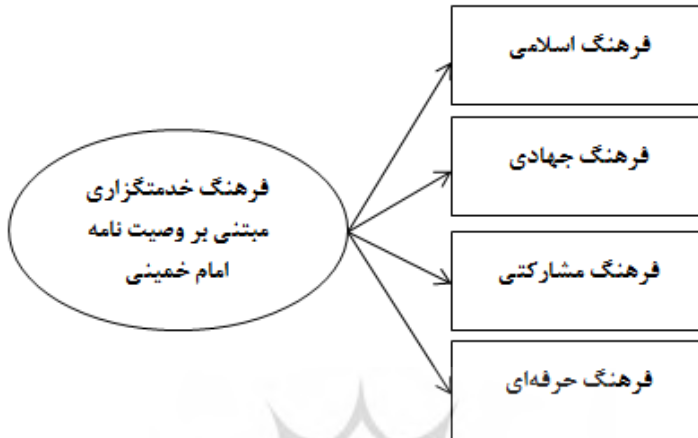
شکل ۳. مدل ساختاری فرهنگ خدمتگزاری مبتنی بر وصیت‌نامه الهی-سیاسی امام خمینی * (منبع: یافته‌های پژوهش)

بر این، پس از ارائه مؤلفه‌های فرهنگ خدمتگزاری و ارائه آن به خبرگان پژوهش (جدول ۳)، مدل ساختاری فرهنگ خدمتگزاری مبتنی بر اندیشه‌های امام خمینی * طبق شکل (۳) ارائه شد.