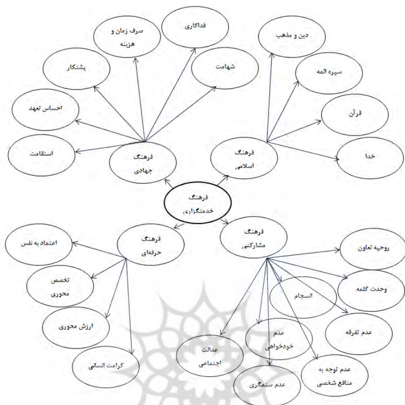
شکل ۲. شبکه مضامین فرهنگ خدمتگزاری مبتنی بر وصیت‌نامه الهی - سیاسی امام خمینی

در ادامه، به منظور تدوین مدل فرهنگ خدمتگزاری در اندیشه امام خمینی، شبکه مضامین به همراه جدول‌های کامل کدهای باز، مضامین پایه و سازمان دهنده با عنوان پرسش‌نامه، به خبرگان ارائه شد تا دیدگاه‌های خود را راجع به دسته‌بندی‌های صورت گرفته از "کاملاً اصولی" تا "غیراصولی" بیان کنند. تأیید یا عدم تأیید این کدها و مضامین با استفاده از آزمون دو جمله‌ای در نرم‌افزار SPSS صورت گرفت. اگر عدد معناداری (Sig)، با نقطه برش ۳/۵، بزرگ‌تر یا مساوی با ۰/۰۵ به دست آمد، آن کد را تأیید نشده در نظر گرفتیم. شایان ذکر است، تمام عددهای معناداری (Sig) مرتبط با مضامین پایه در ناحیه قابل قبول قرار گرفتند و به این ترتیب، کلیت مدل ارائه شده (مضامین پایه و سازمان دهنده) مورد تأیید قرار گرفت.