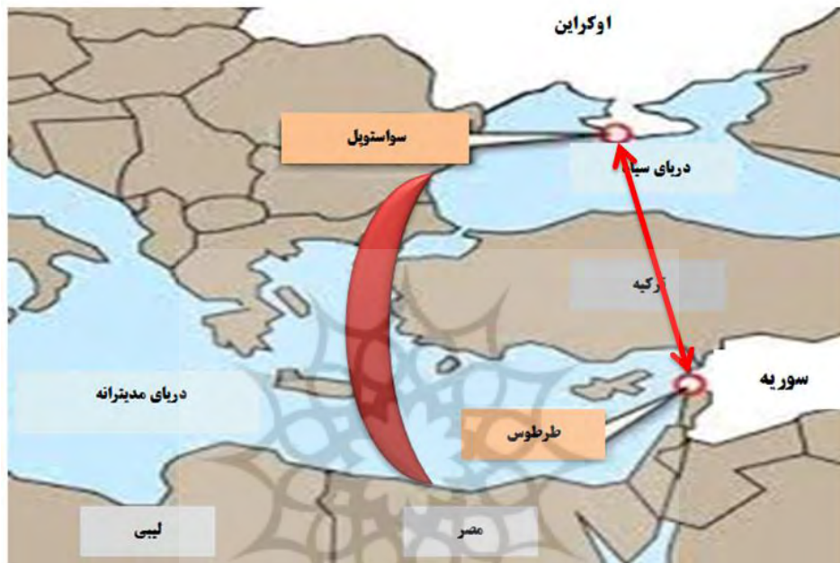
نقشه (۱): هلال موازنه گر بندر تا بندر (سوآستوپل - طرطوس)

اوکراین ترسیم شود و همچنین اگر یک هلال مصنوعی بین دریای سیاه و دریای مدیترانه ترسیم نمایم به اهمیت این بندر به مثابه «هلال موازنه گر» در برابر غرب پی خواهیم برد. این هلال قدرت زیادی به عملیات های دریایی روسیه در مدیترانه و دریای سیاه بخشیده است. از این منظرگاه هنگامی که از اهمیت سوریه برای مسکو صحبت به میان می آید، آنها حفظ و گسترش پایگاه دریایی در بندر طروس و پایگاه هوایی حمیمیم را برای خود تضمین شده می دانند که نه تنها حضور خود در این کشور بلکه ظرفیت آنها را در کل شرق مدیترانه تقویت می کند (Janine, 2018, P.2).