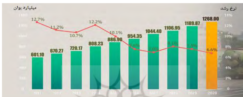
شکل ۲. رشد بودجه دفاعی چین بین سال‌های ۲۰۲۰-۲۰۱۱