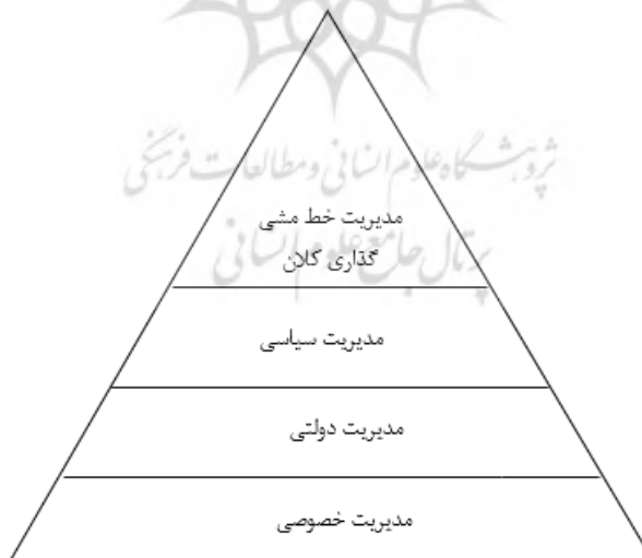
شکل ۱. سطوح مدیریت در ایران

در ایران چهار سطح برای مدیریت قائل شده‌اند که چهار سطح خط‌مشی‌گذاری را ایجاد می‌کند. این سطوح در شکل ۱ آمده است. ۱. سطح مدیریت ابرخط‌مشی‌ها که رهبری نظام و مشاوران تخصصی ایشان این وظیفه را برعهده دارند. ۲. سطح مدیریت سیاسی که برعهده قوای سه‌گانه است و خط‌مشی‌های میانی در این سطح تدوین می‌شود. ۳. سطح مدیریت اداره امور عمومی که اجراکننده خط‌مشی و مشاوره‌دهنده در تدوین خط‌مشی است. ۴. سطح مدیریت بخش خصوصی که فقط به بخش خصوصی مربوط نیست و به کلیت جامعه اشاره دارد و می‌تواند با یک مدیریت دولتی کارآ و اثربخش در جهت بهبود و رشد جامعه عمل کند (دانایی‌فرد، ۱۳۹۵، ص. ۳۸۷).