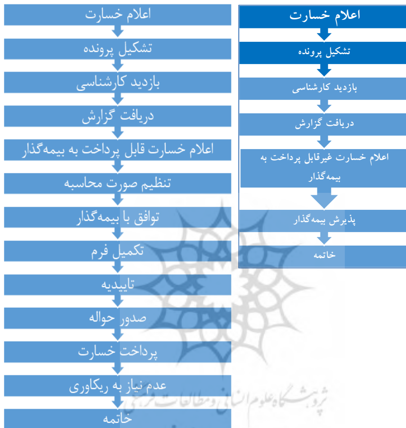
شکل ۳. پرتکرارترین الگوی مسیر انجام فعالیت‌های فرایند (الگوی اول و دوم)

جهت بررسی بیشتر و یافتن الگوهای پر تکرار فرایند، داده‌ها خوشه‌بندی می‌شوند. دو الگوی شکل (۴) بیشترین مسیر تکرار شده را نشان می‌دهد.