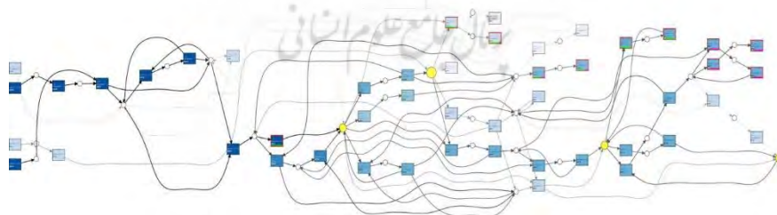
شکل ۵. خروجی پلاگین بررسی انطباق پرام

در شکل (۵)، خروجی بررسی انطباق همان مدل فرایند با رنگ‌بندی‌های مشخص دیده می‌شود. بنابراین آنچه که در تصویر مشاهده می‌شود فعالیت‌های با فرکانس بالاتر رنگ آبی تیره‌تری به خود می‌گیرند. بنابراین این فعالیت دفعات بیشتری انجام می‌گیرند. همچنین بعضی فعالیت‌ها دارای یک رمز قرمز است. این نوار قرمز تعداد دفعاتی را که فعالیت به صورت صحیح انجام گرفته و نیز تعداد دفعاتی که در مقابل مسیر متفاوتی را طی کرده است، را نشان می‌دهد. مشخصات و جزئیات موارد انحرافی را می‌توان بازیابی کرده و تحلیل شوند. علوم انسانی و مطالعات فرهنگی