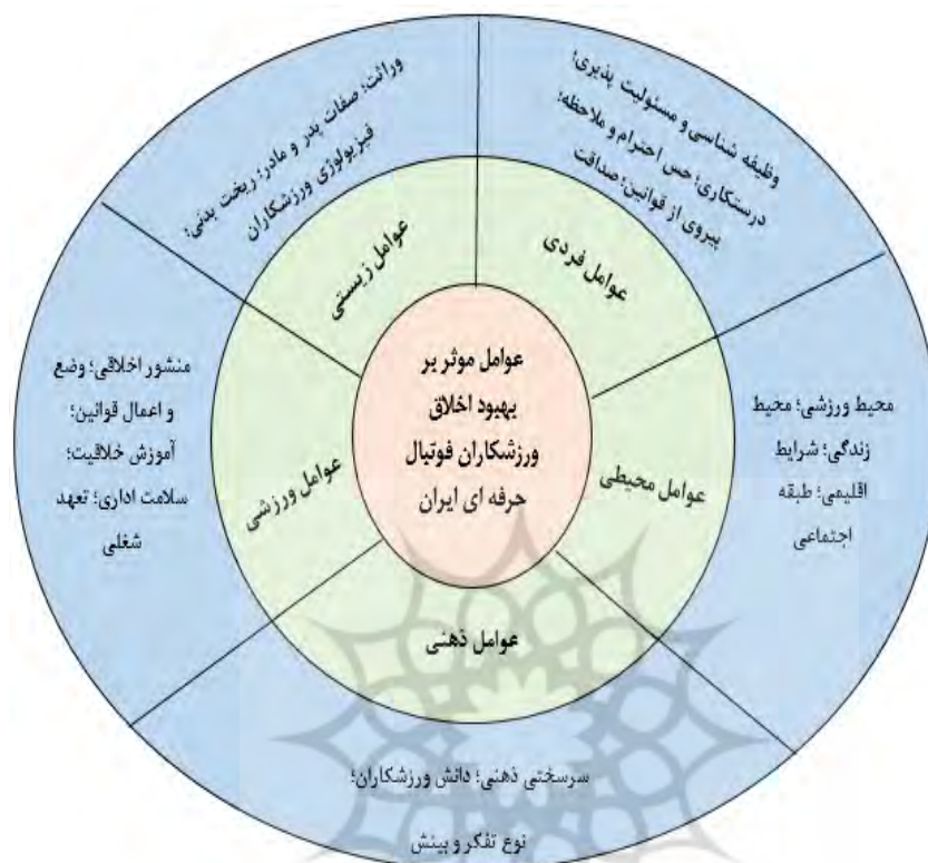
شکل ۱- عوامل مؤثر بر بهبود اخلاق ورزشکاران فوتبال حرفه ای ایران

در جهت بررسی و ارزیابی مدل پژوهش، از آزمون و جدول شماره ۱ مدل ساختاری و اندازه گیری مربوط معادلات ساختاری استفاده گردید. شکل شماره ۲ و ۳ به عوامل را به نمایش گذاشته است.