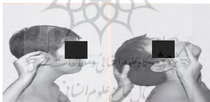
شکل ۲- اندازه‌گیری دامنه حرکتی اکستنشن گردن

برای ارزیابی دامنه حرکتی باز شدن گردن، روی صندلی مستقر می‌شد به‌صورتی که گردن و سر در وضعیت آناتومیکی قرار داشتند. در این حالت ستون فقرات فرد با پشتی صندلی حمایت می‌شود. سپس، محور گونیامتر روی مجاری گوش خارجی، بازوی ثابت گونیامتر عمود بر زمین و در راستای سر و بازوی متحرک گونیامتر نیز روی سطح بینی قرار می‌گرفت. از آزمودنی خواسته می‌شد تا حد ممکن گردن را به عقب خم کند و عدد گونیامتر به‌عنوان رکورد فرد ثبت می‌شد. آزمون دو بار انجام و میانگین آن به‌عنوان رکورد فرد ثبت می‌شد (۱۷) (شکل ۲).