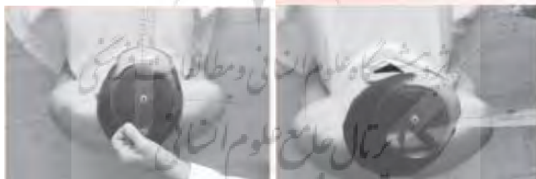
شکل ۴- اندازه‌گیری دامنه حرکتی چرخش گردن

برای ارزیابی دامنه حرکتی چرخش گردن، آزمودنی روی صندلی مستقر می‌شد به‌صورتی که گردن و سر در وضعیت آناتومیکی قرار داشتند. در این حالت ستون فقرات فرد با پشتی صندلی حمایت می‌شود. سپس، محور گونیامتر در مرکز جمجمه، بازوی ثابت گونیامتر موازی با خط فرضی بین دو زائده آخروی و بازوی متحرک گونیامتر نیز در راستای نوک بینی و موازی با دیپرسور زبان قرار می‌گرفت. سپس از آزمودنی خواسته می‌شد تا حد ممکن گردن را بچرخاند. بعد از اینکه آزمودنی گردن را تا بیشترین حد ممکن می‌چرخاند، عدد گونیامتر به‌عنوان رکورد فرد ثبت می‌شد. آزمون دو بار انجام و میانگین آن به‌عنوان رکورد فرد ثبت می‌شد (۱۷) (شکل ۴).