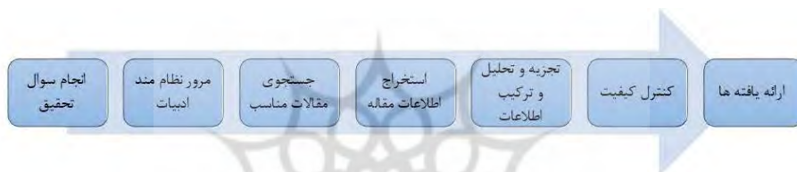
شکل ۱. گام‌های فراترکیب سندلوسکی و باروسو

از روش تحقیق نظریه بر خاسته از داده‌ها و یکد گلیزری استفاده شد. در بخش کمی پژوهش با نظرسنجی از خبرگان روایی مدل را آزمون شد. در مرحله فراترکیب بخش کیفی جامعه مورد بررسی کتاب‌ها، اسناد و مقالات پژوهشی با موضوع عوامل مؤثر بر توسعه به کارگیری انرژی تجدیدپذیر شامل ۴۰ مقاله و پایان نامه بود که به دلیل محدودیت تعداد صفحات مقاله فقط در قسمت فهرست منابع آورده شده است (۱۳-۵۲). شیوه گردآوری داده در این مرحله مطالعه کتابخانه‌ای و اسنادی و روش تجزیه و تحلیل اطلاعات نیز تحلیل محتوا بود. در مرحله نظریه داده بنیاد و نظرسنجی خبرگان از مشاوره ۷ نفر از خبرگان دانشگاهی که در زمینه مدیریت انرژی تجدیدپذیر صاحب نظر بودند و با روش داده بنیاد آشنایی داشتند، استفاده شد. شیوه گردآوری داده‌ها در نظرسنجی خبرگان پرسشنامه محقق ساخته شامل ۱۲۸ سؤال بود و کیفیت تقسیم بندی مفاهیم را مورد سؤال قرار می داد و روش تجزیه و تحلیل اطلاعات سیگمای شمارشی بود.