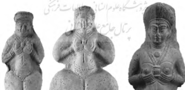
تصویر شماره ۳. (Daems, p. 765)