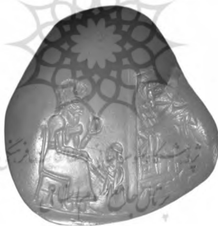
تصویر شماره ۵. سنگ اهدایی شیلپیک اینشوشینک به دخترش بر اولی