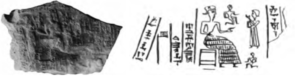
تصویر شماره ۱. مهر یافت شده از هفت تپه به شماره ۲۹۳۴ (Roach, p. 472)