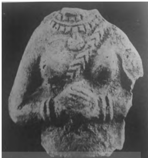
تصویر شماره ۴. نقش برجسته یک زن از ایلام میانه، گل پخته، موزه ایران باستان

نقش سیاسی زنان درباری و دودمان سلطنتی در تاریخ ایلام میانه (۱۵۰۰-۱۱۰۰ پم) / ۱۰۹