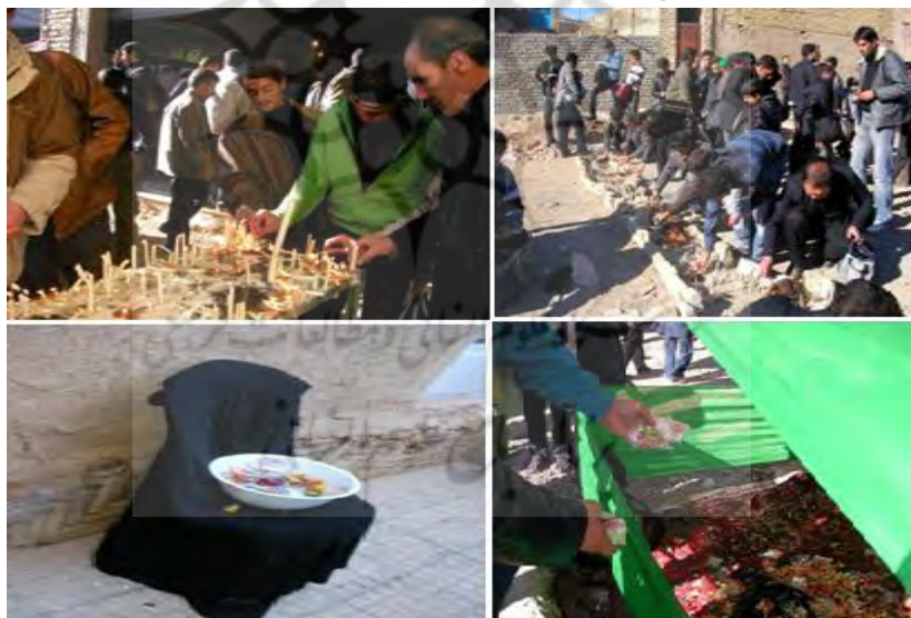
شکل ۱- جلوه‌هایی از مراسم چهل و یک منبری در شهرضا

اولین منبر -امامزاده شاهرضا- به عنوان مقدس‌ترین مکان برای مردم شهرضا می‌باشد. در قدیم این امامزاده در محدوده بیرون شهر قرار داشته است که ساکنین اطراف آن روستایی به نام شاهرضا را تشکیل می‌دادند. امروز با گسترش شهر امامزاده شاهرضا در ورودی شهر از سمت اصفهان قرار گرفته است. عده‌ای این امامزاده را «محمدرضا بن زید بن امام حسن مجتبی (ع)» دانسته و عده‌ای دیگر او را فرزند «امام موسی بن جعفر (ع)» معرفی کرده‌اند (رک: دایره المعارف تشیع، ذیل امامزاده شاهرضا: ۲/۴۴۸ و حاجی قاسمی، ۱۳۸۹: ۱/۷۴).