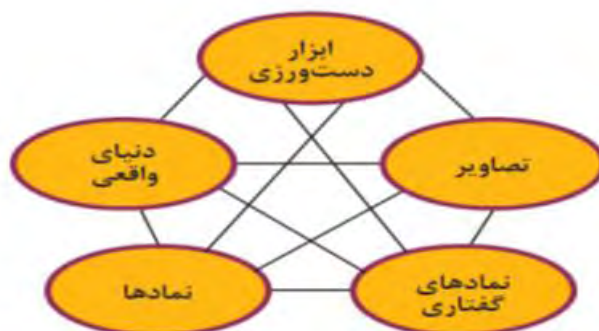
شکل ۱. مدل بازنمایی های چندگانه لش