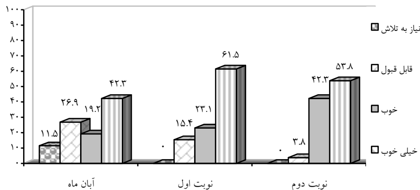
شکل (۲) نمودار ستونی درصد فراوانی نمرات درسی دانش‌آموزان در آبان ماه، نوبت اول و نوبت دوم

همانطور که مندرجات جدول و شکل (۲) نشان می‌دهد، تعداد دانش‌آموزانی که نمرات خیلی خوب و خوب گرفته‌اند در نوبت دوم (خرداد ماه) نسبت به اوایل سال تحصیلی (آبان ماه) افزایش داشته است.