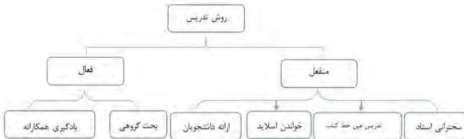
نمودار ۱. مضامین سازمان دهنده و پایه مربوط به روش تدریس اساتید

نمودار ۱، مضامین سازمان دهنده و پایه مربوط به روش تدریس اساتید را از نگاه دانشجویان نشان می‌دهد.