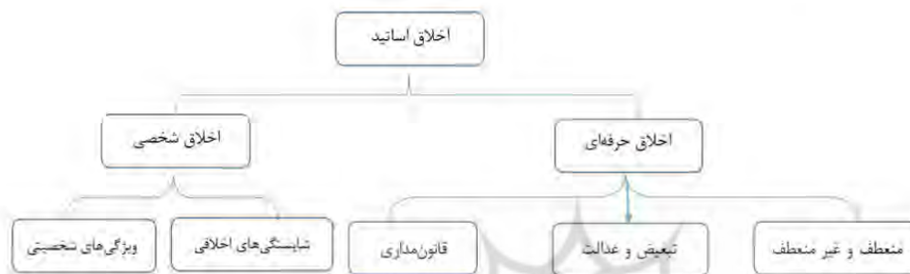
نمودار ۵. مضامین سازمان دهنده و پایه مربوط به اخلاق اساتید

نمودار ۵، مضامین سازمان دهنده و پایه مربوط به اخلاق اساتید را از نگاه دانشجویان نشان می‌دهد.