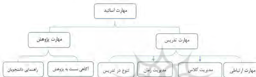
نمودار ۴، مضامین سازمان دهنده و پایه مربوط به مهارت اساتید

نمودار ۴، مضامین سازمان دهنده و پایه مربوط به مهارت اساتید را از نگاه دانشجویان نشان می‌دهد.