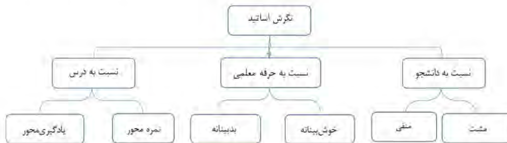
نمودار ۲. مضامین سازمان دهنده و پایه مربوط به نگرش اساتید

نمودار ۲، مضامین سازمان دهنده و پایه مربوط به روش تدریس اساتید را از نگاه دانشجویان نشان می‌دهد.