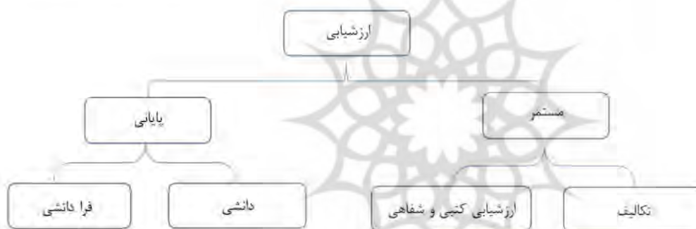
نمودار ۶، مضامین سازمان دهنده و پایه مربوط به ارزشیابی اساتید

نمودار ۶، مضامین سازمان دهنده و پایه مربوط به ارزشیابی اساتید را از نگاه دانشجویان نشان می دهد.