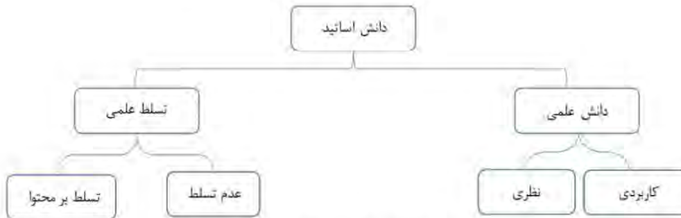
نمودار ۳. مضامین سازمان‌دهنده و پایه مربوط به دانش اساتید

نمودار ۳، مضامین سازمان‌دهنده و پایه مربوط به دانش اساتید را از نگاه دانشجویان نشان می‌دهد.