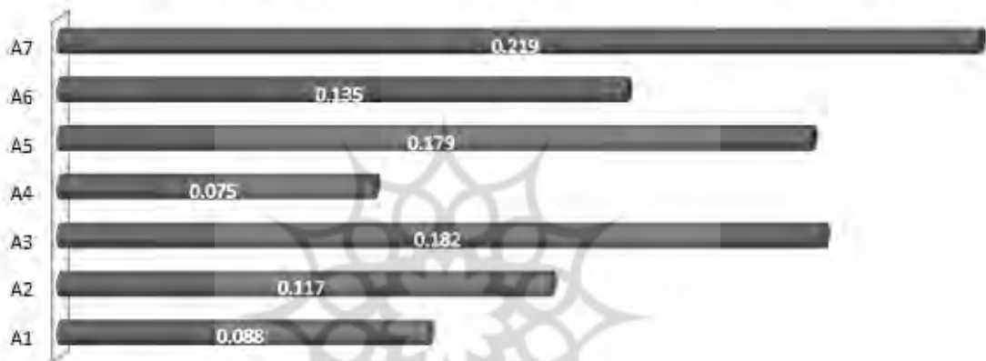
Disadvantages of ideal planning in the optimal allocation of operating budgets