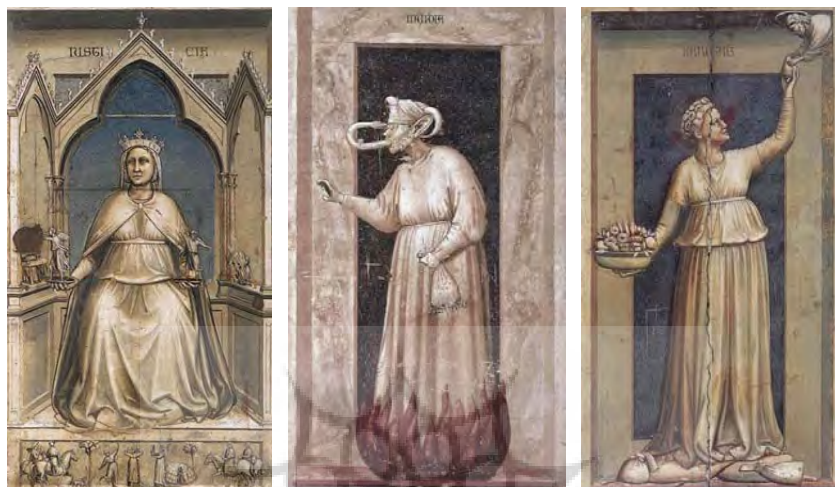
تصویر ۵: بخشی از نقاشی دیواری اثر جوتو، نمازخانه آرنو «نکوکاری» تصویر ۶: بخشی از نقاشی دیواری اثر جوتو، نمازخانه آرنو «آز» تصویر ۷: بخشی از نقاشی دیواری اثر جوتو، نمازخانه آرنو «عدالت»

ابتدا شباهت روپوش خدمتکار، سبب می‌شود تا پروست وی را به نقاشی جوتو (تصویر ۵) ببرد. اما جلوتر که می‌رود، شباهتی میان بدن سنگین شده خدمتکار باردار با سترگی هیکل زن نکوکار درمی‌یابد. اما او باز هم جلوتر می‌رود و این شباهت‌ها را از ظاهر به درون شخصیت‌ها می‌برد. او چهره سرد و بی‌روح هر دو را از بی‌اطلاعی‌شان از کار معنوی‌ای که بدان مشغول‌اند، می‌داند: