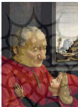
تصویر ۱۳: نقاشی «پرتره مرد پیر و پسرخوانده‌اش»، اثر گیرلانداو

در بند بالا، پروست به طور مشخص هیچ تمایزی بین کالدهای نقاشی و شخصیت‌های رمانش قائل نمی‌شود. آن قدر مرز نقاشی با ادبیات را در هم می‌نوردد که مخاطب توان جداسازی شخصیت‌های آثار نقاشی با شخصیت‌های رمان را از دست می‌دهد و هر کدام را جای دیگری تصور می‌کند. ادبیات به نقاشی می‌رود و نقاشی به ادبیات و جان می‌گیرد. سوان نیز مثل پروست، شخصیت‌های پیرامونش (شخصیت‌های رمان) را به شخصیت‌های نقاشی‌ها مانند می‌کند. در اصل، پروست در اینجا خودش را پشت سوان پنهان می‌کند. در چند خط بعد، پروست دلیل این همانندسازی توسط سوان را این طور توضیح می‌دهد: