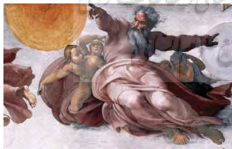
تصویر ۴: بخشی از نقاشی «خلقت ماه و خورشید» اثر میکل‌آنژ

«چه درختان که همچنان در کار زیستن خویش بودند، و هنگامی که دیگر برگ‌شان نبود زندگی بر غلاف مخمل سبزی که تنه‌هایشان را در میان می‌گرفت بهتر می‌درخشید، یا بر مینای سفید کره‌های داروش که بر فراز سپیدارها، گرد، چون خورشید و ماه در آفرینش میکل‌آنژ روییده بودند. اما از آنجا که پس آن همه سال‌ها، و با پیوند گونه‌ای، ناگزیر از همزیستی با زن بودند، حوری جنگلی را به خاطر می‌آوردند» (پروست، ۱۳۸۸: ۵۵۰).