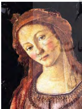
تصویر ۱۰: بخشی از نقاشی «عذرای انار»، اثر بوتیچلی