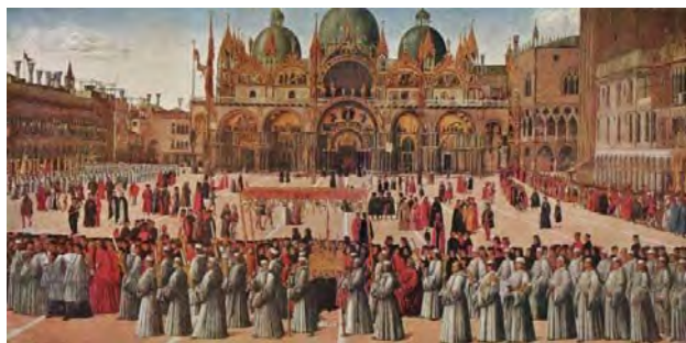
تصویر ۱۵: نقاشی «میدان سن مارکو»، اثر جنتیله بلینی