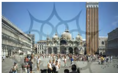
تصویر ۱۶: عکسی از «میدان سن مارکو» در دوران معاصر

پروست می‌گوید تصاویری که از دوران کودکی‌اش در ذهن ثبت کرده، مثل گراورهایی که از آثار بزرگ نقاشی تهیه شده، چیزی را به ما نشان می‌دهند که امروز دیگر محو یا تخریب شده‌اند. پروست در جستجوی زمان از دست رفته است و این جستجو را نه در بیرون، بلکه در درون ذهن می‌داند و آن چنین گراورهایی، به مثابه جاده‌ای بصری عمل می‌کنند که مخاطب خود را به سرمنشأ واقعه و زمان می‌برند. پروست، زمان را تنها مخرب دنیا و زندگی انسان‌ها معرفی می‌کند. به نظر او زمان واقعی ترکیبی است از حال و گذشته؛ و نقش گذشته و خاطرات گرانقدرش در شکل‌گیری تصویر کنونی انسان از حال را نباید فراموش کرد. او به سیر خطی زمان اعتقادی ندارد؛ زمان همیشه در حال سیر به گذشته است و زمان حال هرگز به تنهایی معنا ندارد. برای پروست گذشته نمی‌میرد و خاطرات، گذشته را در ذهن بشر احیا می‌کنند (پایان‌بنام و دلور، ۱۳۸۷). می‌توان گفت توصیف‌های همراه با ریزترین جزئیات در رمان وی، ناشی از آن است که پروست داستان را روایت نمی‌کند؛ بلکه به دنبال روایتی است که تصویر