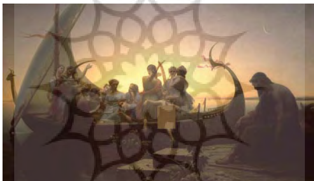
تصویر ۲: نقاشی «خیال از دست رفته»، اثر چارلز گلیر

«گاهی در آسمان بعد از ظهر، ماه، سفید چون ابری کم‌پشت، دزدکی، بی‌جلوه، می‌گذشت، چون بازیگری که زمان بازی اش نرسیده باشد و بخواهد چند دقیقه‌ای با آرایش و جامه عادی، بی‌سروصدا و بی‌آن که کسی خبر شود، بازی دوستانش را از تالار تماشا کند. از دیدن تصویرش در تابلوها و کتاب‌ها لذت می‌بردم. اما این آثار هنری [...] با آن‌هایی که ماه را امروز به نظرم زیبا می‌نمایانند [...] تفاوت داشت. مثلاً رمانی از ستین، یا منظره‌ای از گلیر که در آن‌ها ماه، روشن و آشکار چون داسی سیمین در آسمان به چشم می‌زد» (پروست، ۱۳۸۸: ۲۳۰-۲۲۹).