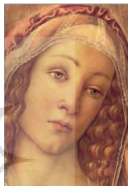
تصویر ۹: بخشی از نقاشی «بهار» (زنان پریمورا)، اثر بوتیچلی

«حالت افسرده‌ای که اودت همچنان نشان می‌داد، سرانجام مایه شگفتی‌اش شد. چهره‌اش در آن هنگام بیش از همیشه او را به یاد صورت زنان پریمورا ۱۹ می‌انداخت. همان رخسار دژم و ستوهیده آنان را داشت که گویی زیر بار اندوهی سنگین‌تر از توانشان خرد می‌شوند، هنگامی که فقط بازی عیسای شیرخواره با اناری، یا آب ریختن موسی در لاوکی را نظاره می‌کنند» (همان: ۳۸۴).