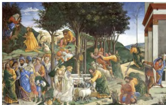
تصویر ۱۱: نقاشی «آب ریختن موسی در لاوکی»، اثر بوتیچلی