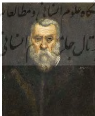
تصویر ۱۴: تک‌چهره خود نقاش، اثر تینتور تو