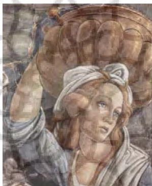
تصویر ۱۲: بخشی از نقاشی «آب ریختن موسی در لاوکی»، اثر بوتیچلی

در هر سه این نقاشی‌ها -زنان پریمائورا، عذرای انار و آب ریختن موسی در لاوکی- (تصاویر ۹ تا ۱۲)، زنی افسرده در حال تحمل بار سنگین درونی است که آثار این تحمل، در چهره معصومش هویداست. هر سه، بی توجه به آن چه پیرامونشان در حال رویداد است، به جایی بیرون از کادر چشم دوخته‌اند و گویی در مکان یا زمان دیگری سیر می‌کنند. مارسل پروست این سه شخصیت در نقاشی را با هم یکی می‌کند و حاصل این یکی شدن، "اودت" است. با دیدن این سه زن، تصویری که از اودت در ذهن مخاطب نقش می‌بندد، همان چیزی است که پروست می‌خواهد نه چیز دیگر. پروست با این کار، تصویرسازی قوه خیال در خواننده را به کنترل خویش می‌گیرد. وی در طول رمان بارها از شباهتی که میان "اودت" با