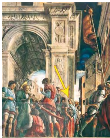
تصویر ۸: بخشی از نقاشی دیواری «شهادت یعقوب قدیس».