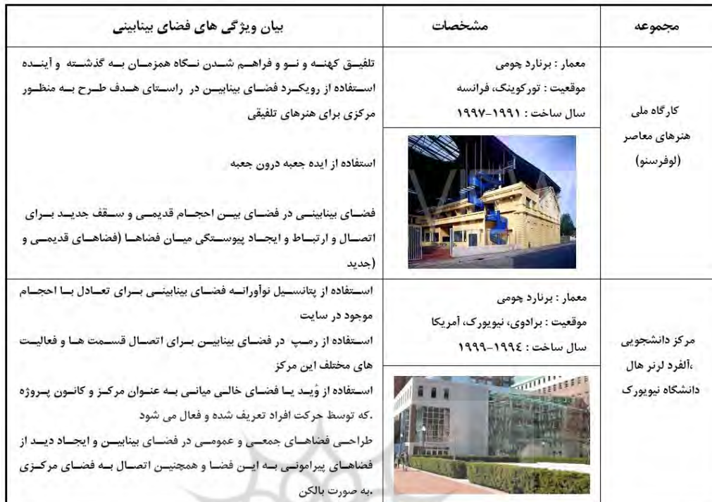
جدول ۳- تحلیل و بررسی معیارها و شکل گیری فضای بینابین در مصادیق خارجی انتخاب شده