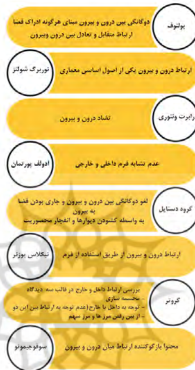
نمودار ۱- دیدگاه ها و نظریه ها در ارتباط با مفهوم درون و بیرون

ویژگی های مفهوم مرز میان درون و بیرون: در تعامل بین فضای داخلی و خارجی، فضاهای انتقالی به عنوان فضاهای بینابین یا میانی شناخته می شوند که می توان با توجه به ویژگی فضایی و همچنین درجه ادغام شان در بخش اصلی ساختمان آن ها را طبقه بندی کرد که به واسطه همین فضاهای مابین درون و بیرون مجموعه ای از فرصت های طراحی برای معماران و طراحان ایجاد شود (Roura & Maragno, 2011, 2). لذا برای شناخت و دستیابی به ویژگی های فضایی درون و بیرون نیاز به یک چارچوب نظری مدون است که با استناد به مطالعات اولیه در زمینه فضاهای مابین، مؤلفه هایی برای مفهوم مرز ارتباط بیرون و درون در نظر گرفته شده است. از جمله عوامل وجوه فضای بینابین می توان به عوامل محیطی-کالبدی، عملکردی-رفتاری، اداری-معنایی اشاره کرد.