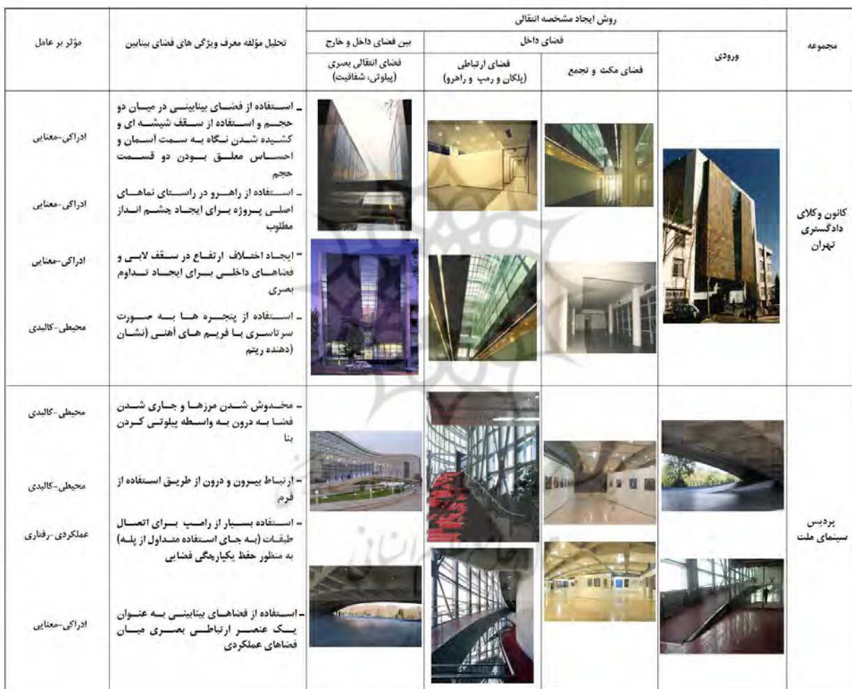
جدول ۴- تحلیل و بررسی معیارها و شکل گیری فضای بینابین در مصادیق داخلی انتخاب شده

حال با توجه به ماهیت هنرمآبانه معماری باید در نظر داشت که در این بخش ممکن است پروژه ای به طور همزمان در برادرنده ویژگی های مختلفی از فضای مابین باشند. در همین راستا عوامل فضای مابین در قالب سه دسته در نظر گرفته شده اند: کالبدی، عملکردی، معنایی و روش ایجاد مشخصه انتقالی در چهار دسته طبقه بندی شده اند. علاوه بر آن، به منظور شفاف کردن هرچه بیشتر نتایج حاصل از این نوشتار با استفاده از یک بررسی تطبیقی، میزان کیفی استفاده از فضای مابین در نمونه های معماری مبتنی بر این مبانی مورد بررسی قرار می گیرد. در واقع تحلیل عامل کالبدی و عملکردی موضوعی کاملاً عینی محسوب می شوند و به طور کامل برای ایجاد ارتباط، فضای بینابین طراحی می شود و با بهره گیری از عناصر و اجزاء معماری نمود پیدا می کند ولی عامل معنایی (ادراکی) جزء دریافت های ذهنی انسان از محیط اطراف دسته بندی می شوند و تنها با ایجاد شفافیت و دید بدون مانع برای فرد و یا با در نظر گرفتن فعالیت های مشابه موجب می شود فرد هر دو فضا را در امتداد هم و احساسی از بینابینی و پیوستگی در فرد ایجاد کند.