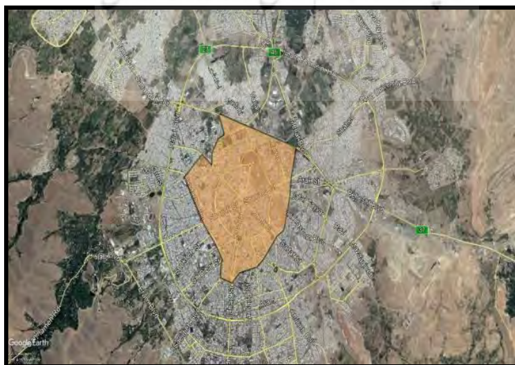
تصویر ۴- نقشه موقعیت محدوده مورد مطالعه در نقشه شهر همدان (google earth, 2018)

محدوده مورد مطالعه تحقیق رینگ مرکزی شهر همدان را شامل می‌شود که هسته مرکزی شهر همدان نیز که شامل بازار و محیط‌های اداری و تجاری می‌باشد نیز در این قسمت قرار دارد. با توجه به تراکم جمعیتی نسبتاً چشم‌گیر در این منطقه، ترافیک در رفت‌وآمد و همچنین آلودگی هوا و صوتی در این پهنه نسبت به بقیه نقاط شهری همدان بیشتر است. شکل‌های بعدی موقعیت این منطقه را نسبت به دیگر نقاط شهر نشان می‌دهد.