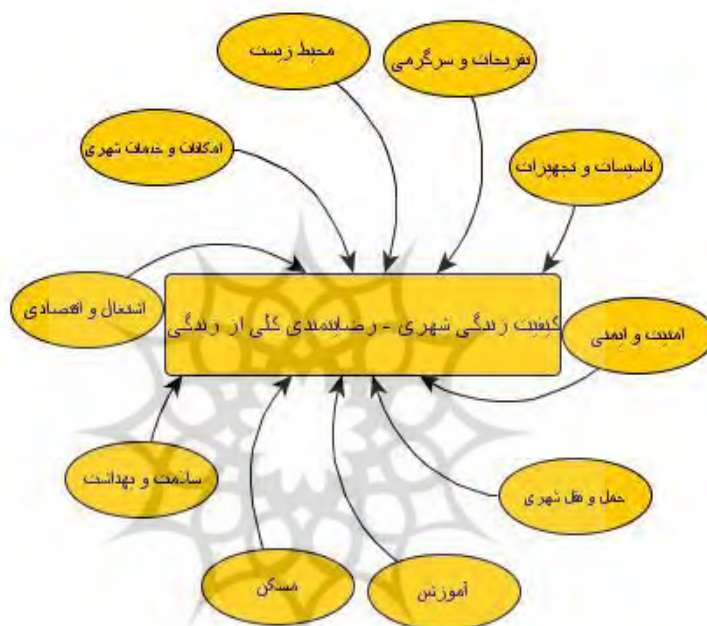
تصویر ۳- مدل مفهومی تحقیق جهت ارزیابی مناطق شهری

جمع‌بندی و نتیجه‌گیری از چارچوب اقدام در مقایسه و تفسیر شاخص‌های ذهنی بر اساس داده‌های عینی و بالعکس بر اساس گزینه اول انتخاب‌شده در این مطالعه شاخص‌های عینی و ذهنی هر کدام به‌صورت جداگانه در فرایند تحلیل‌های کمی وارد خواهند شد و مورد آزمون قرار خواهند گرفت. در این فرایند روش تفسیر بر اساس نتایج نهایی مدل‌های رگرسیونی دو نوع شاخص ذهنی و عینی خواهد بود. تفسیر روابط علت و معلولی بین این دو وجه بر اساس ضرایب اهمیت و تأثیر هر یک از شاخص‌های به‌کاررفته در تحلیل و میانگین رضایتمندی‌های موجود در شاخص‌های مربوط از یک‌سو و تعیین حوزه‌های نیازمند مداخله از سوی دیگر خواهد بود. در همین راستا، با توجه به مطالعات انجام‌شده در جمع‌بندی کلی می‌توان شاخص‌های مورد ارزیابی را در ارتباط با چگونگی اثرگذاری خدمات زیربنایی و زیرساخت‌های شهری بر کیفیت زندگی شهروندان همدانی را بر مبنای مرور ادبیات پژوهش مطابق مدل (۳-۴) در نظر گرفت. در مرحله بعدی با توجه به این جدول پرسشنامه‌ای ساختاریافته تبیین خواهد شد و خوانش ذهنی شهروندان همدانی نسبت به شاخص‌های مورد مطالعه در نرم‌افزار SPSS به دست خواهد آمد.