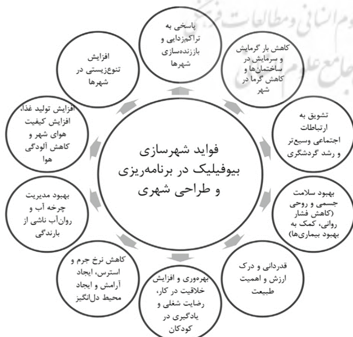
شکل ۱: فواید شهرسازی بیوفیلیک

مفهوم بیوفیلیک به این منظور مدنظر قرار گرفته که انسان ها به ارتباط نزدیکتر با طبیعت و ایجاد شهرهایی که حساسیت بیشتری نسبت به سیستم های طبیعی دارند، خصوصا در ایران، نیازمندند. به این خاطر بهتر است رویکردهایی نظیر بیوفیلیک در طراحی لبه رودخانه هایی که در مجاورت بافت شهری قرار دارند به کار گرفته شوند تا ماهیت طبیعی آنها حفظ شده و یا ارتقا یابد. توجه به مفهوم حساس به آب نیز به جهت ماهیت رودخانه که با عنصر آب در ارتباط تنگاتنگ است و حضور و حیاتش به آب وابسته است ضروری است تا توصیه ها و موارد کاربردی مفهوم طراحی شهری حساس به آب نیز در طراحی و یا ساماندهی رودکناره های شهری بررسی گردیده و مدنظر قرار گیرد.