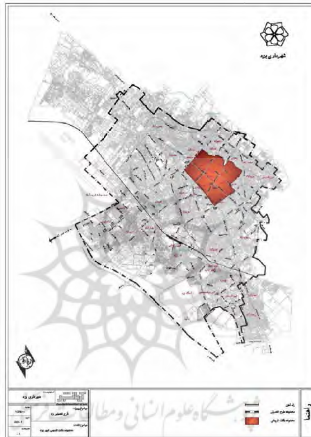
تصویر ۲- محدوده بافت قدیمی شهر یزد (مهندسین مشاور شمس، ۱۳۸۵)

بافت تاریخی شهر یزد؛ (تصویر ۲) شامل اصلی‌ترین محلات قدیمی حدفاصل خیابان دهم فروردین و شهید رجایی در جنوب، بلوار دولت‌آباد و شهید سعیدی در غرب، بلوار بسیج و دهه فجر در شرق و خیابان فهادان، ده متری بعثت و کوچه سراج در شمال است که بر اساس توافق بین دفتر بهسازی بافت قدیم وزارت مسکن و شهرسازی، سازمان مسکن و شهرسازی استان یزد، شهرداری ناحیه تاریخی و سازمان میراث فرهنگی و گردشگری استان یزد به علت ارزش‌های فرهنگی و هویتی خاص، بافت تاریخی نام‌گرفته است (کلانتری خلیل‌آباد و همکاران، ۱۳۸۵: ۱۷).