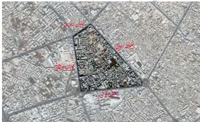
تصویر ۴- تصویر هوایی از برزن پشت باغ

معرفی محله پشت باغ: وجه تسمیه محله پشت باغ؛ باغی بوده‌اندی توسط عزالدین لنگر از اتابکان یزد موسوم به باغ عزآباد که بعدها خشکیده و خراب شده است. در گذشته شغل ساکنین محله نساجی بوده و صنف مسگر نیز در قسمتی از محله پشت باغ ساکن بوده‌اند. محله پشت باغ یکی از محدوده‌های شهری و از مناطق مرکزی شهر یزد است و در بخش جنوبی بافت قدیم قرار دارد. این محله از طریق چهار خیابان اصلی محدود می‌شود. از شمال به بلوار امامزاده، از جنوب به خیابان فرخی، از شرق به خیابان شهید رجایی و از غرب به خیابان شهید مطهری احاطه شده است (بشارت، ۱۳۸۵: ۲۷). در سال ۱۳۸۵ ۱۳ محله پشت باغ؛ (تصویر ۴) دارای جمعیتی معادل ۲۴۰۷ نفر یعنی ۵/۶۲ درصد از جمعیت کل بافت تاریخی بوده است. همچنین در محله پشت باغ ۷۱۸ خانوار ساکن می‌باشند که این میزان معادل ۵/۹۴ نفر از خانوارهای بافت و ۰/۶۳ نفر از خانوارهای شهر است (مهندسین مشاور آران‌شهر، ۱۳۸۵).