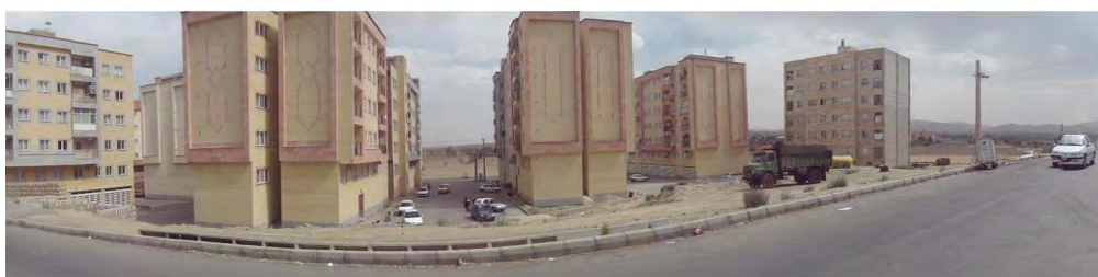
تصویر ۳- نمای کلی از سایت