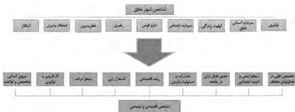
شکل ۱: مؤلفه‌های شهر خلاق و شاخص اقتصادی و اجتماعی (مأخذ: نگارنده)

جدول (۱): متغیرها و شاخص‌های به‌کاررفته در تحقیق (مأخذ: نگارنده)