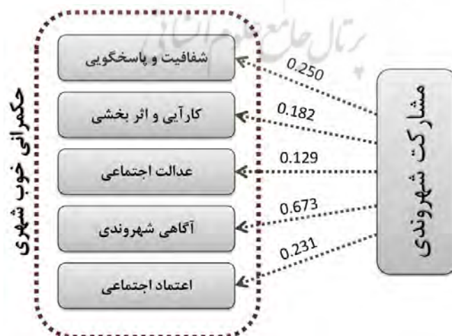
شکل ۲- ضرایب استاندارد شده (Beta) تاثیر مشارکت مردمی بر پنج شاخص مدیریت شهری ماخذ: نگارندگان

بعد از اطمینان از وجود رابطه میان متغیرها با استفاده از روش همبستگی پیرسون، برای تعیین میزان این ارتباطات از آزمون رگرسیون چند متغیره استفاده شد. این بررسی نشان داد که مشارکت شهروندی بر هر پنج عامل تاثیر مثبت دارند و همچنین مشخص گردید که میزان تاثیرگذاری بر عامل آگاهی شهروندی نسبت به سایر متغیرها زیادتر می باشد.