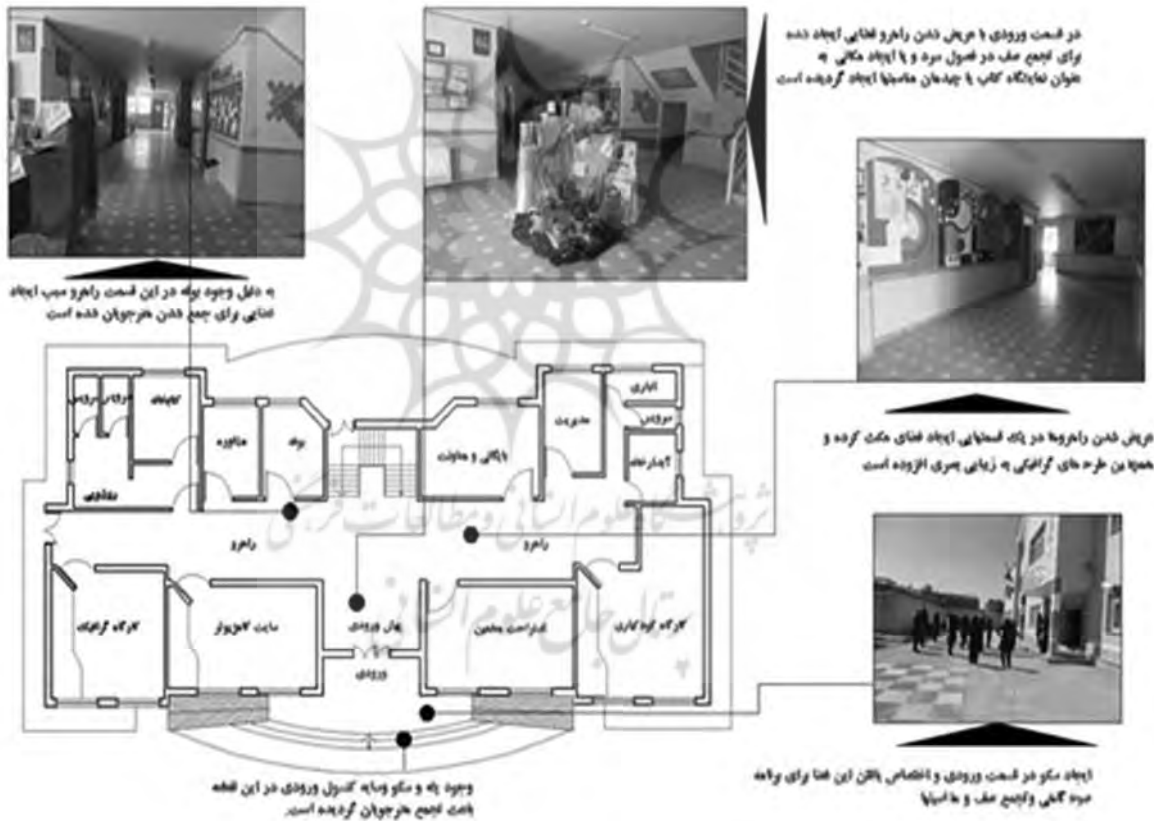
تصویر ۴- نقاط شاخصی که در پلان باعث تعاملات اجتماعی گردیده است مشخص شده است

در کل می‌توان گفت این مکان آموزشی همانند خیلی مدارس، فقط به مورد آموزشی آن پرداخته است، ما عقیده‌مان بر این است که سیستم آموزش و پرورش در دو حیطة آموزش و پرورش گام برمی‌دارد، ولی متأسفانه هیچ‌گونه فضایی که بشود در آن پرورش فکری و شخصیتی دانش‌آموز در نظر گرفته شود یا وجود ندارد یا اگر هم هست به دلیل ناکارآمد بودن آن، می‌توان گفت وجود ندارد. با تحقیق در مکان‌های آموزشی که در مدارس قدیم ایران و مدارس استاندارد که در خارج از کشور ساخته شده‌اند یا تعداد محدودی که در حال حاضر در ایران وجود دارد صورت پذیرفت، به این نتیجه رسیدیم که می‌توان یک دانش‌آموز رو فقط صرفاً در کلاس رشد نداد، می‌توان