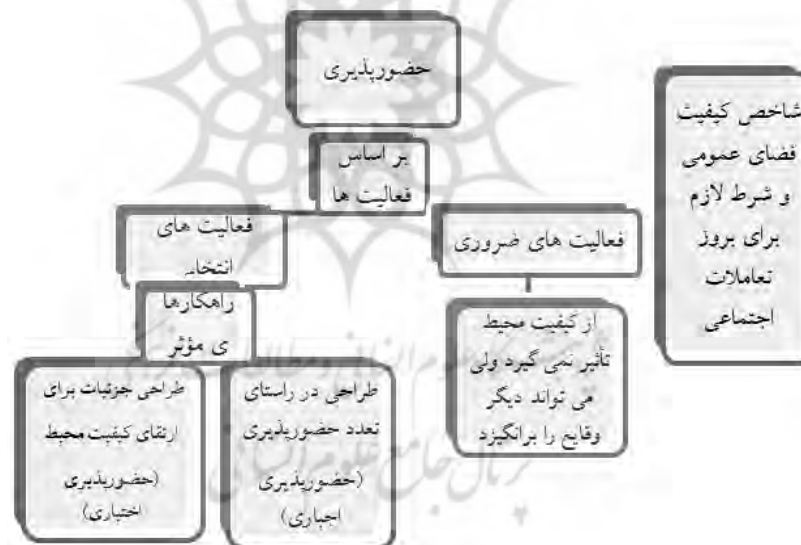
تصویر ۱- شاخص کیفیت فضای عمومی و شرط لازم برای بروز تعاملات اجتماعی