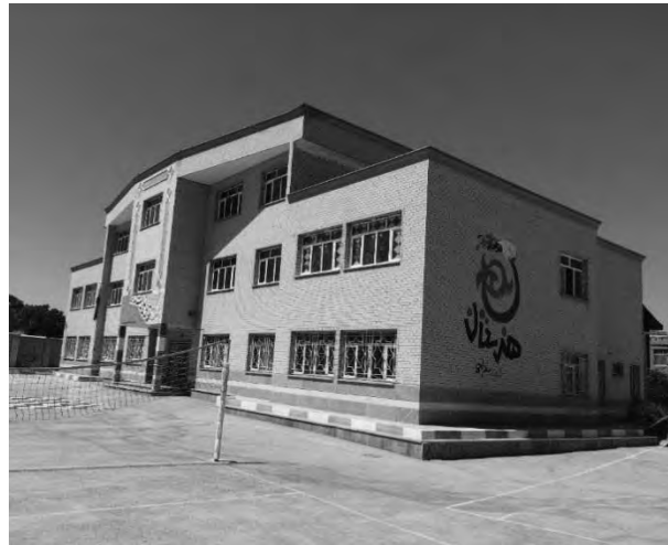
تصویر ۳- هنرستان شهید قدرت‌اله سادجی