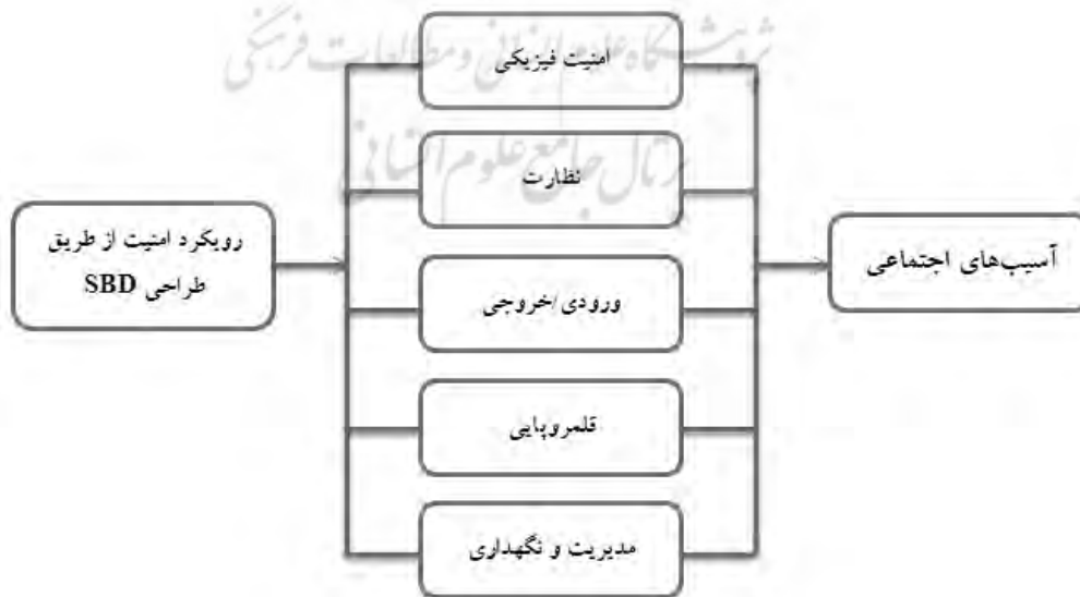
تصویر ۲- مدل مفهومی تحقیق

در پژوهش حاضر از روش ترکیبی استفاده شده است، به این ترتیب که از روش پیمایش ۱ در زمره روش‌های کمی و از روش بحث گروهی متمرکز ۲ در زمره روش‌های کیفی بهره گرفته شده است. در روش پیمایش، برای تعیین حجم نمونه از فرمول کوکران استفاده می‌شود، بر اساس این فرمول حجم نمونه‌ای که از جامعه آماری تحقیق به دست آمد، با توجه به جامعه آماری تعداد ۱۰۰ پرسشنامه که ۴۰ عدد توسط متخصصین شهری و کلانتری محل در ارتباط با آسیب‌های اجتماعی و ۶۰ عدد توسط مصاحبه از ساکنین محله حاج شمسعلی شهر همدان با توجه به مقتضی‌ایات تحقیق، میزان خطای قابل قبول در این پژوهش ۰/۰۷ در نظر گرفته شد و در سطح اطمینان ۹۰٪ مورد بررسی قرار گرفت. در شکل ۱ مدل مفهومی ارائه شده است.