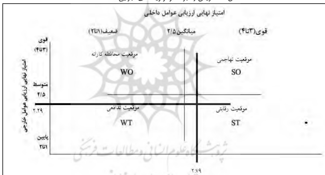
شکل ۴: ماتریس راهبردها و اولویت‌های اجرایی SWOT

در نهایت امتیاز عوامل درونی (2/79) و بیرونی (2/29) بر روی ماتریس عوامل درونی-بیرونی منتقل می‌شود. این ماتریس یا همان ماتریس راهبردها و اولویت‌های اجرایی گویای این است که اگر بازآفرینی محله تاریخی حاجی با بهره‌گیری از رویکرد بازآفرینی بخواهد صورت بپذیرد؛ پیاده‌سازی راهبردهای گروه رقابتی ST باید در اولویت قرار بگیرد.