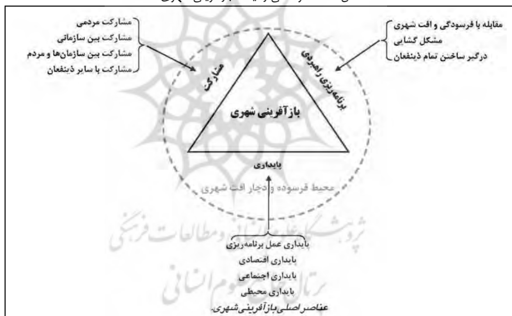
شکل ۳: عناصر اصلی رهیافت بازآفرینی شهری

پایداری، برنامه‌ریزی راهبردی و مشارکت، سه ضلع مثلث رهیافت بازآفرینی شهری را تشکیل داده و پایه‌ای برای اقدام در بازآفرینی شهری فراهم میکنند. به عبارت دیگر، مشارکت (شامل مشارکت مردمی، مشارکت بین سازمانی، مشارکت بین سازمانها و مردم و سایر ذینفعان)، برنامه‌ریزی راهبردی (شامل مقابله با فرسودگی و افت شهری، مشکل گشایی و درگیر ساختن تمام ذینفعان) و توجه به اهداف پایداری (شامل پایداری اقتصادی، اجتماعی و محیطی و پایداری عمل برنامه‌ریزی) عناصر اصلی رهیافت بازآفرینی شهری را تشکیل میدهند (Batey, 2000).