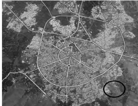
تصویر ۱- موقعیت مسکن مهر حصار نسبت به مرکز شهر همدان

شهر همدان بررسی شود می‌توان به‌سادگی به گسستگی شدید فضایی-کالبدی نسبت به شهر همدان در این مناطق پی برد در این تحقیق، محله حصار مورد بررسی قرار گرفت. رویکرد مورد نظر برای بررسی کیفیت زندگی در این تحقیق، رویکرد ذهنی است.