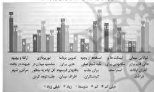
شماره ۲ پاسخ‌ها به سوالات، عوامل بیرونی (تهدید)