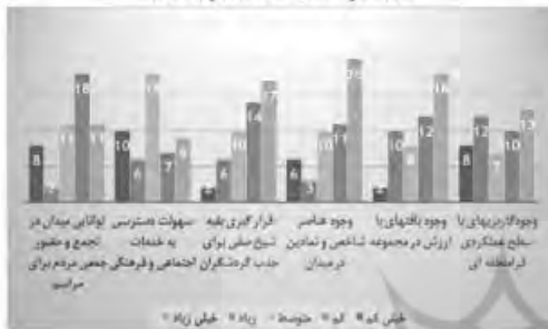
شماره ۲ پاسخ‌ها به سوالات، عوامل بیرونی (تهدید)