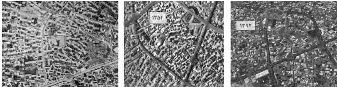
تصویر ۱- عکس هوایی میدان عالی قاپو

وجه تسمیه میدان عالی قاپو: واژه عالی قاپو مربوط به دوره صفویه بوده است که کپی شده و تکمیل شده آثار عثمانی می باشد. در لغت نامه عثمانی این نام (باب عالی) معنا شده که در لغت عربی باب به معنی (در) است که در زمان صفوی این واژه به زبان ترکی معنا شد که در زبان ترکی در به معنی (قاپو) است که واژه باب عالی به معنی (در بزرگ، وسیع) معنی می دهد. به همین خاطر به دلیل اینکه این میدان در جلوی عمارت شیخ صفی الدین قرار داشت از دروازه بزرگ و وسیعی برخوردار بود این نام (عالی قاپو) نام گذاری شد که بعدها وقتی دولت عثمانی به اصفهان کوچ کردند از طرح و معنای وسیع بودن میدان عالی قاپو استفاده کردند و طرح و شکل مربعی میدان عالی قاپو را طرح ریزی کردند. به عبارت دیگر میدان عالی قاپو اصفهان الهام گرفته از میدان عالی قاپو اردبیل است. تصویر ۱ که در ادامه عکس های تحول میدان در سالیان دور تا امروز ارائه شده است (امیری، ۱۳۸۴).