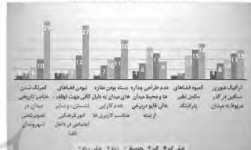
شماره ۴ پاسخ‌ها به سوالات، بیرونی (تهدید)