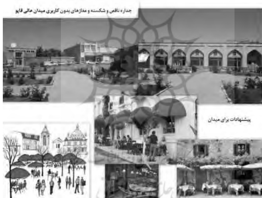
تصویر ۵- پیشنهاد کاربری فعال (میدان عالی قاپو)