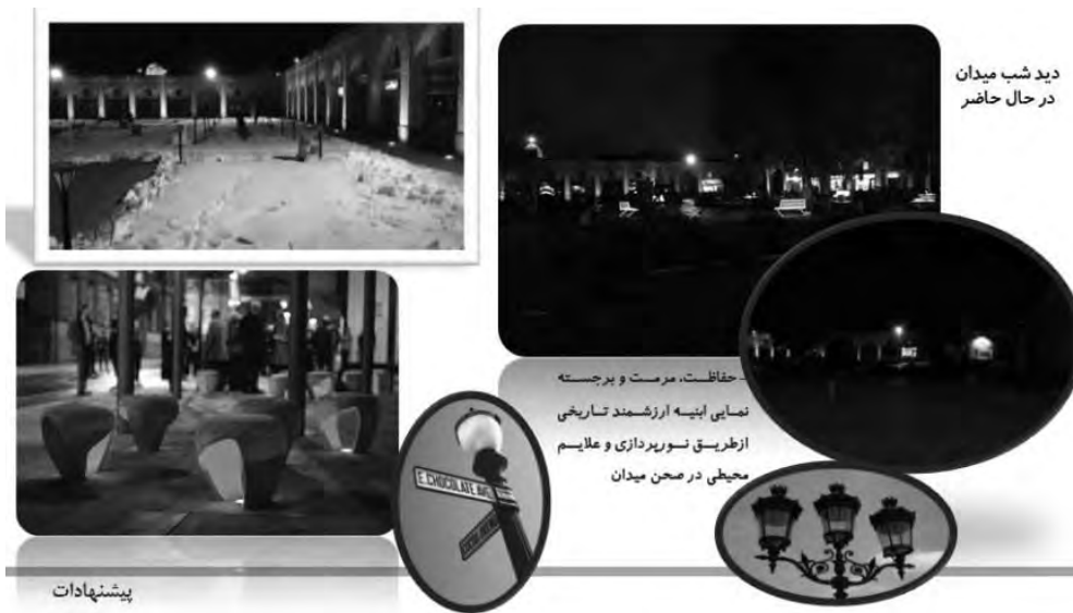
تصویر ۴- پیشنهاد نورپردازی مناسب (میدان عالی قاپو)