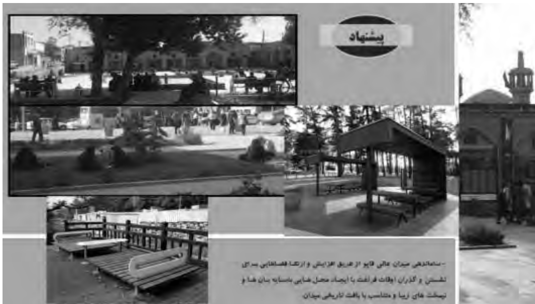
تصویر ۶- پیشنهاد نیمکت‌های مناسب (میدان عالی‌قاپو)

راهبردهای مختلف برای میدان عالی‌قاپو تعیین گردید. حال به مرحله آخر می‌رسیم؛ یعنی تعیین کنیم در مجموع چه نوع راهبردی برای برگرداندن فضاهای شهری دیروز مناسب بوده و سمت‌وسوی راهبردهای ما به کدام سو است. در یک محور این مرحله را انجام می‌دهیم. در مجموع چهار نوع راهبرد تعیین می‌شود: