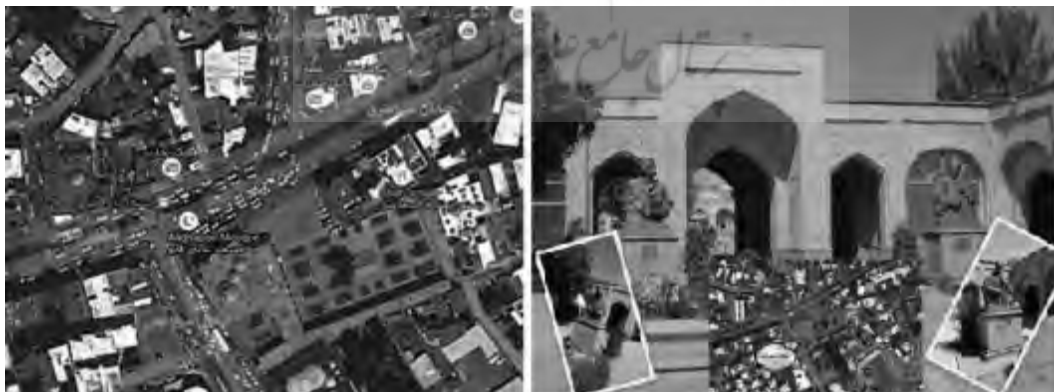
تصویر ۲- فرم میدان و دسترسی میدان عالی قاپو

ساخت فضایی: بررسی میدانی مؤلفه های تأثیرگذار بر شکل گیری خاطره جمعی در میدان عالی قاپو نشان می دهد که فضای میدان بستر مناسبی برای شکل گیری خاطره جمعی را فراهم آورده است. این امر ناشی از غلبه حرکت پیاده بر سواره در داخل میدان بوده و همچنین مفصل عبوری پیاده مردم برای ارتباط محلات خود نیز بوده است که در طی روز مورد استفاده قرار گرفته است. عملکرد