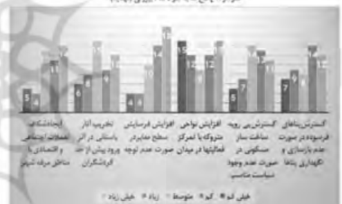
تصویر ۳- پاسخ به سوالات