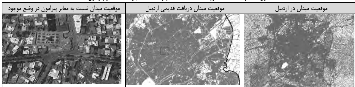
جدول ۳- موقعیت سایت مورد مطالعه نسبت به شهر، بافت قدیم و شبکه معابر پیرامون

شهر اردبیل یکی از کهن‌ترین شهرهای ایران به شمار می‌رود. این شهر در طول تاریخ سیاسی خود قرن‌های متمادی مرکز آذربایجان و زمانی پایتخت کشور ایران بوده است. کوه سبلان در مغرب اردبیل قرار گرفته است. فاصله سبلان تا شهر حدود ۴۰ کیلومتر است. بلندترین قله این کوه زیبا حدود ۴۸۷۰ متر از سطح دریا ارتفاع دارد. ارتفاع شهر اردبیل از سطح دریا حدود ۱۲۶۰ متر است. میدان عالی‌قاو در مرکز بافت کهن و تاریخی اردبیل به‌عنوان فضای تاریخی و قدیمی شهر معروف بوده است که در گذشته مورد توجه مردم شهر بوده است، اما امروز معنا و هویت خود را کمرنگ‌تر می‌بیند (جدول ۳).