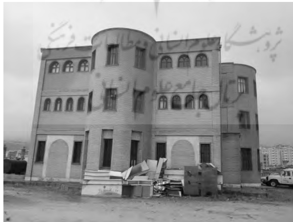
تصویر ۱- کانون فرهنگی کودک و نوجوان شهر ایلام

با توجه به مدل تحقیق شکل (۱) و (۲) که سطح معنی‌داری تأثیر عوامل محیطی و سپس فضای سبز از دیدگاه معماری و امنیت و کنجکاوی را از دیدگاه خلاقیت جز مهم‌ترین عوامل معرفی می‌نماید. لازم به ذکر است با توجه به بازدهی‌های متعدد از کانون پرورش کودکان شهر ایلام همچون کمبود رنگ فضاها، نمایشگاه، موزه، کارگاه، کتابخانه و کمبود فضای سبز مناسب از مهم‌ترین نیازهای کودکان در ارتقا خلاقیت آنها در مدل نشان داده شده است.