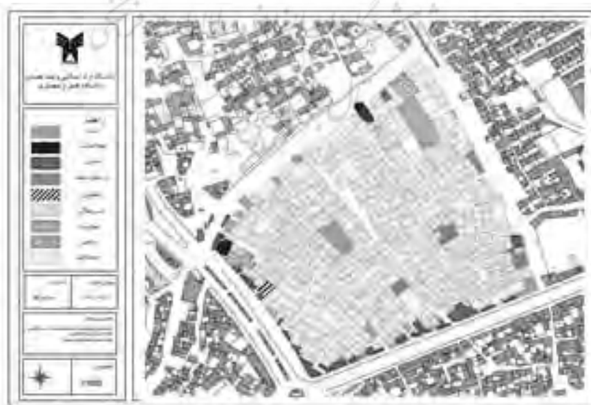
شکل ۲. کاربری اراضی وضع موجود محله جولان همدان

الف) سرانه کاربری‌ها: با توجه به نقش اصلی محله جولان جنوبی که همواره سکونت در آن بخش غالب فعالیت را به خود اختصاص داده است، خدمات پشتیبانی سکونت درصد کمی از بافت را شامل می‌شود که این اراضی عمدتاً در لبه محورهای پیرامونی بافت قرار گرفته‌اند. فعالیت مذهبی که با حضور مساجد و حسینیه‌ها در درون محله متجلی شده است در نقاط متعددی هم در درون و هم پیرامون محله استقرار یافته‌اند. بر این اساس جدول زیر سطوح و زیربنای کاربری‌های موجود در حوزه محلی را نشان می‌دهد.