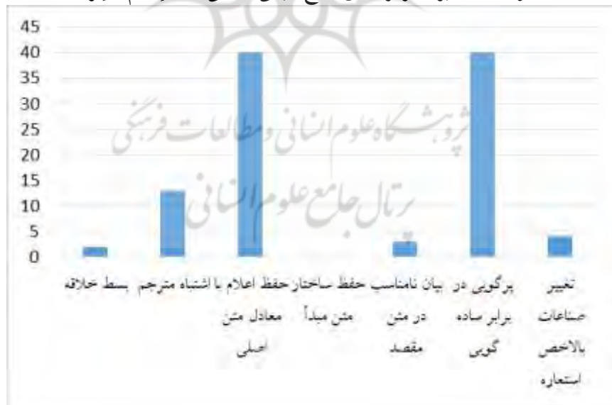
نمودار ۴. کاربرد زیرگروه‌های سطح سبکی - عملی در «الإسلام و ایران»

نمودار ۴) کاربرد زیرگروه‌های سطح سبکی - عملی در «الإسلام و ایران» نمایش داده شده است.