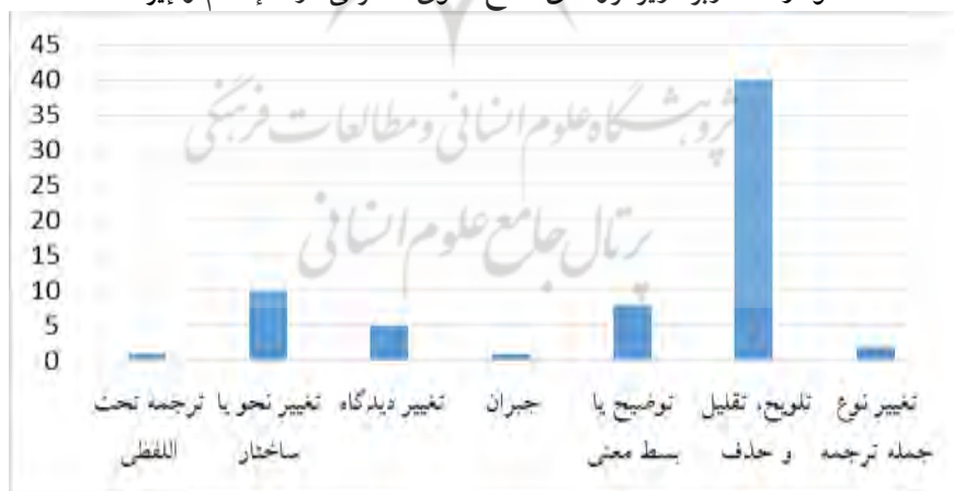
نمودار ۲. کاربرد زیرگروه‌های سطح نحوی - صرفی در «الإسلام و ایران»

در این عبارت، جمله معترضه‌ای که داخل پرانتز آمده و بخشی از نقل قول است از متن اصلی جدا شده و خارج از گیومه به صورت جمله مستقل آورده شده است. نمودار (۲) کاربرد زیرگروه‌های سطح نحوی - صرفی در «الإسلام و ایران» نمایش داده شده است.