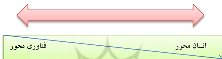
(شکل-۱): طیف جرایم سایبری از انسان محور تا فناوری محور

یک رویداد فردی و مجزا به شمار می‌روند و اغلب توسط ورود بدافزارها به رایانه‌ی قربانی تسهیل می‌شود و ممکن است زمینه این رخداد توسط خود قربانی فراهم شود. نوع دوم: با برنامه‌هایی که زیر مجموعه بدافزارها قرار نمی‌گیرند، تسهیل می‌شوند (پژوهش جهرمی، ۱۳۹۷: ۶۱). جرایم سایبری طیفی را شامل می‌شود که یک سمت آن متکی بر فناوری و سوی دیگر این طیف، متکی بر روابط بین فردی. (شکل-۱)