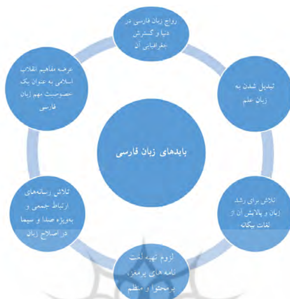
نمودار ۴: بایدهای زبان فارسی در کلام رهبری

اکنون وقت آن فرا رسیده که به بررسی پرسش‌های اصلی پژوهش بپردازیم. ابتدا دوباره پرسش‌های مطرح شده را به ترتیب بیان می‌کنیم؛ سپس، پاسخ هر یک براساس یافته‌های پژوهش ارائه می‌گردد: