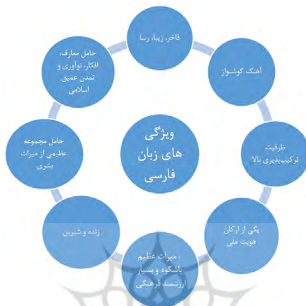
نمودار ۱: ویژگی های زبان فارسی در کلام رهبری

پرسش دوم: توصیف رهبری از وضعیت گذشته‌ی زبان فارسی چگونه است؟ رهبری در بیانات خویش (۱۱) ایران را مهد هنر و ادبیات خوانده‌اند و اظهار داشته‌اند تاریخ این مرز و بوم و گذشته و طبیعت ملت ایران نشان از ادبی و هنری بودن دارد و این که دیر زمانی نیست که ادبیات ایران از غرب استامبول تا شرق آسیا را در بر می‌گرفته، زبان فارسی، زبان دیوانی کشور عثمانی بوده و تا اقصی نقاطی از هند و چین زبان مذهبی، اداری، ادبیات و هنر محسوب می‌شده است. ایشان در بیانی دیگر (۹) جاذبه زبان فارسی را عامل گسترش آن به هند و آسیای صغیر دانسته‌اند و با اطمینان بیان داشته‌اند که اسلام از طریق زبان فارسی و فارسی‌زبانان به چین، شبه قاره و بخشی از آسیای میانه گسترش یافته است و بسیاری از کسانی که در این مناطق به اسلام گرویده‌اند، هنوز یادگارها و نشانه‌های زبان فارسی را در کلمات و اصطلاحات دینی خود حفظ کرده‌اند. در جایی دیگر (۵) ایشان بیان داشته‌اند؛ زمانی چین و روم و آسیای صغیر مرز زبان فارسی را تشکیل می‌دادند و در آن زمان توسعه و گسترش زبان فارسی از نفوذ