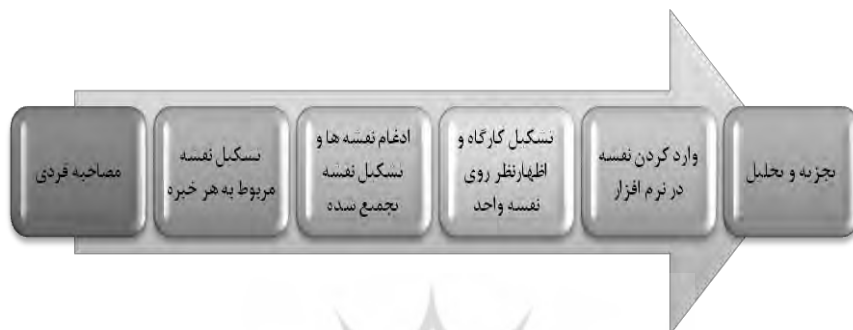
شکل ۱- مراحل روش تحلیل و توسعه گزینه‌های استراتژیک (فخیمی آذر، مالک و

سازمانی را در قالب این مدل مورد بررسی و تجزیه و تحلیل قرار داد. با استفاده از این مدل عوامل دخیل در یک مساله در قالب سه دسته از عوامل (رفتاری، ساختاری و زمینه‌ای) مورد بررسی قرار می‌گیرد (میرزایی، طالقانی و سعدآبادی، ۱۳۹۲). لذا در این پژوهش نیز با بهره‌گیری از این مدل به تجزیه و تحلیل راهکارها پرداخته است.