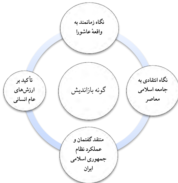
شکل شماره (۲). ویژگی‌های گونه بازاندیش

گونه هیئت‌های بازاندیش را می‌توان با این ویژگی‌ها توصیف کرد: نگاه زمانمند به واقعه عاشورا، نگاه انتقادی به جوامع اسلامی معاصر، تأکید بر ارزش‌های عام انسانی، و منتقد گفتمان نظام جمهوری اسلامی ایران.