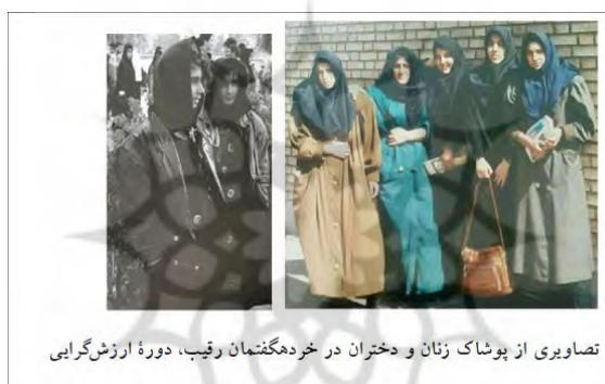
تصاویری از پوشاک زنان و دختران در خرده‌گفتمان رقیب، دوره ارزش‌گرایی

در این خرده‌گفتمان، الگو و رنگ و تزئین لباس‌های زنانه به تدریج تنوع یافت. این نوع پوشش عملاً دال‌های شناوری هستند که در دوره بعد یعنی در دوران سازندگی (توسعه) برجسته‌تر شدند. مانتوهایی گشاد و بلند با سرشانه‌های بزرگ که دارای تنوع بیشتری در قطعات الگو بود، دیگر سادگی مانتوهای پیشین را نداشت؛ به کمربند مزین شد یا در الگوی اولیه برای آنها «کمر» در نظر گرفته شد. کت‌ها یا مانتوهای چرمی که براق بود و با دکمه‌های متعدد نیز تزئین می‌شد، رواج پیدا کرد.