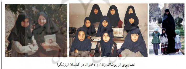
تصاویری از پوشاک زنان و دختران در گفتمان ارزش‌گرا

بسیاری از تولیدات فیلم‌های سینمایی دهه ۱۳۶۰، در نمایندگی گفتمان ارزش‌گرایی تولید شد که درباره انقلاب و یا دفاع مقدس بود. فارغ از ضوابط پوشش زنان برای تأیید پخش این آثار، زیبایی‌شناسی پوشاک زنان در آنها، مظهر زیباشناختی ارزشی زنان انقلابی و الگوی مطلوب بود. در این آثار، زنان معمولاً در فضاهای عمومی از مقنعه و چادر سیاه استفاده می‌کردند و در درون خانه نیز از چادرهایی به رنگ روشن‌تر. پوشاک زنان پوشاندگی بسیار زیادی داشت. مانتوها نیز مچ‌دار و روسری‌ها بلند بوده و با سنجاق بسته می‌شد و همراه مانتو و مقنعه برای پوشش خارج از خانه، از چادر استفاده می‌شد. بنابر این، بازنمایی هدفمند زیبایی‌شناسی در نوع خاصی از پوشاک زنان شکل می‌گرفت که دارای ویژگی‌هایی بود که به‌طور کامل در انطباق با پوشش اسلامی مد نظر گفتمان حاکم قرار داشت.