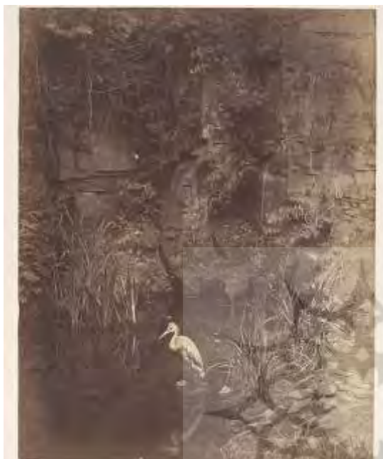
Piscator No. II , by John Dillwyn Llewelyn, ۱۸۵۶, via the Metropolitan .

یکی از اولین عکسهای شناخته شده از حیوانات در سال ۱۸۵۶ توسط جان دیلوین لوولین از یک حواصیل گرفته شده است.