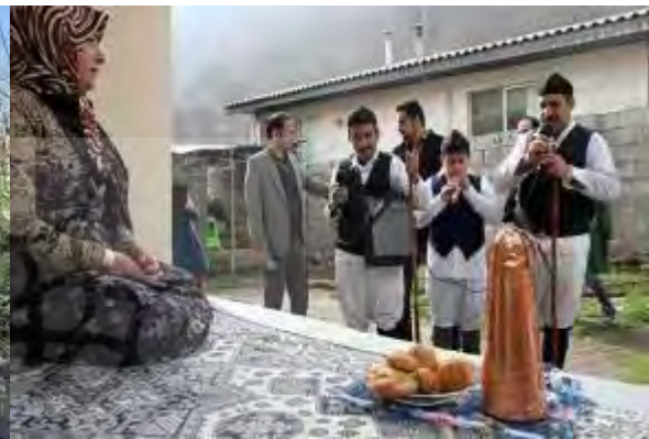
شکل ۱۷- نوروزنامه خوانی سنتی هویت‌بخش به فضاهای شهری؛ نوروزنامه خوانی در منطقه گیلان ( http://shabestan.ir )