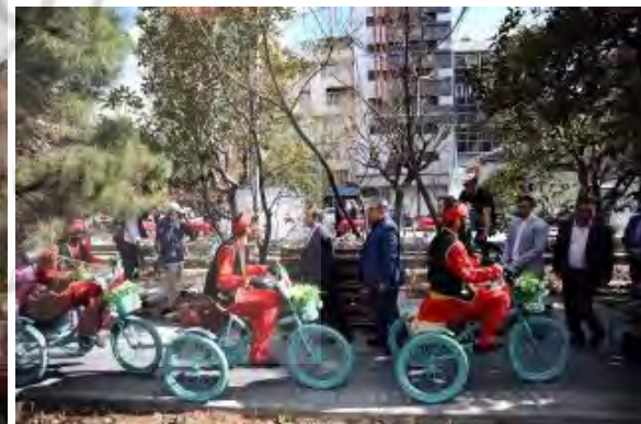
شکل ۱۸- رویدادهای نوروزگاهی به مثابه آیین‌هایی هویت‌بخش به فضاهای شهری؛ فضای شهری نوروزگاهی در بلوار کشاورز تهران (راست) فضای شهری نوروزگاهی در منطقه ۱۷ تهران (چپ) ( http://farhangi.tehran.ir )

برگرفته از هنرهای ایرانی اسلامی بر کالبد فضاهای شهری در طول دوره‌های مختلف ایجاد می‌شود که عامل پیوند زندگی شهری با مفاهیم و مضامین فرهنگی و اجتماعی یا تاکید و محوریت تفکر و احساسات ایرانی- شیعی و کانونی برای تقویت معنا، آرامش‌بخشی به شهر، یکی از مهمترین عناصر ساختاری شهری و فضایی بومی برای حیات هویت‌مند محلی