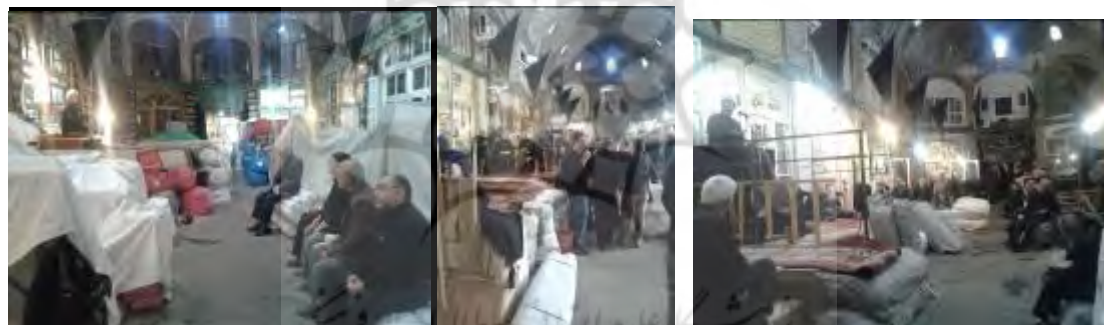
شکل ۱۴- نظم فرهنگی و اجتماعی؛ برگزاری مراسم روضه در تیمچه‌های سه‌گانه حاج شیخ در ایام محرم ۱۳۹۵

در تیمچه‌های سه‌گانه حاج شیخ که سه تیمچه هم‌شکل مجاور هم در ضلع شرقی راسته بازار جدید مراسم وعظ، روضه و مرثیه امام حسین(ع)، همه روزه در ایام محرم برگزار می‌شود. در این مراسم که روحانی بر منبری که بر روی کالاهای مقابل حجره‌ها