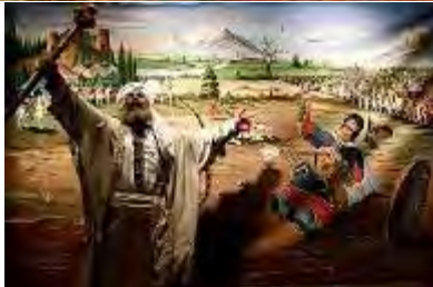
شکل ۳- الف) تابلوهای نمایش رزم حماسی ایرانی، فضای متناسب با رویدادی نمایشی و تماشاگران (ب) نقاشی قهوه‌خانه‌ای؛ نمایش تعزیه در جامعه ایرانی

۱-۲- تعزیه، به عنوان هنری نمایشی: هنرهای نمایشی یکی از مهم‌ترین هنرهای آیینی است که برای تحقق و برگزاری به فضای واقعی عمومی متناسبی نیازمند است. تعزیه و شبیه‌خوانی از مهم‌ترین گونه‌های هنرنمایشی بومی ایرانی و اسلامی است. تعزیه به آیین مذهبی عزاداری همراه با آیین‌های خاص و تشریفات که روایتگر فاجعه تاریخی مذهبی سوزناکی است، اطلاق می‌شود. تعزیه را "نمایش منظوم واقعه کربلا"؛ چیزی شبیه "تئاترهای یونانی و رومی در هوای آزاد"؛ "هنرهای نمایشی و ادبیاتی درامی ایرانی... دارای خصلت منحصرأ مذهبی" و ... تعریف کرده‌اند (شرف-الدین، ۱۳۸۵: ۴۶-۴۹).