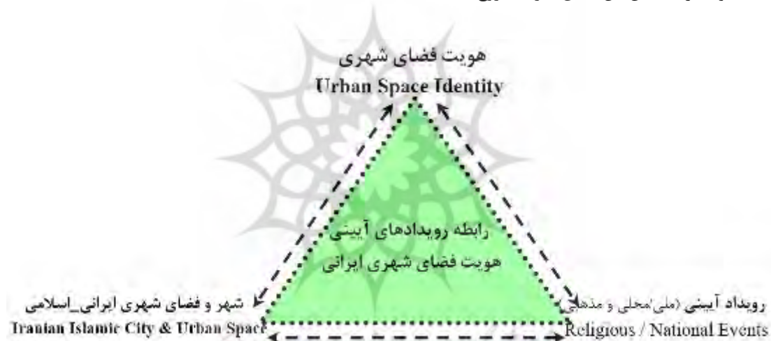
شکل ۲- رابطه بین رویدادهای آیینی ملی_محلی و دینی، فضاهای شهری اسلامی ایرانی و هویت ملی (نگارنده)

دینی برای نیایش و طلب حوائج و دعا برای گشایش در امور یا به‌عنوان مامن و پناهگاهی برای مسافران، در راه‌ماندگان، نیازمندان، فقرا و ... می‌باشد. (همان). عوامل فوق می‌تواند دلایلی بر ماندگاری فضاهای مذهبی در زندگی مردم و اذهان عمومی باشد. نمونه‌های متعددی در کشورهای اسلامی بویژه ایران وجود دارد که این اهمیت کلیدی را نشان می‌دهد: آران و بیدگل، شهر گنبدها و گلدسته‌ها، بطوریکه شهروندان آران و بیدگل این شهر را با امامزاده هلال‌بن‌علی(ع) می‌شناسند. فضاهای مذهبی اغلب به‌عنوان گره یا نشانه در تصویر ذهنی مردم جای دارند. انسان تنها موجودی است که دغدغه هویت دارد زیرا به گفته سارتر، در مورد انسان "وجود بر ماهیت تقدم دارد". یعنی ماهیت انسان محتوم نیست و بر خلاف سایر موجودات، خود در ساختن آن نقش دارد (افروغ، ۱۳۷۷).