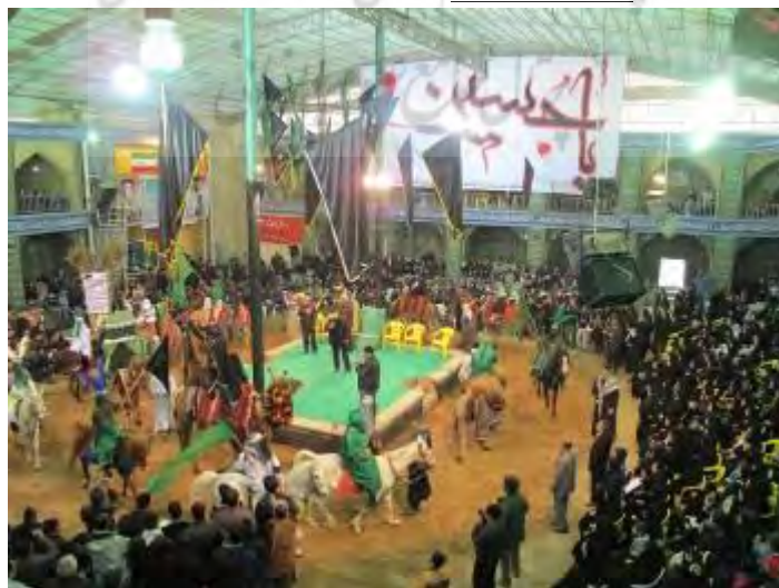
شکل ۴- تعزیه فضایی سرپوشیده

هنر تعزیه، در طول زمان تغییراتی را به خود دیده‌است اما هنوز هم جزو اصیل‌ترین و پرسابقه‌ترین هنرهای ایرانی و اسلامی مردمان ایران است. در استان‌های مختلف ایران از شمالی‌ترین شهرهای خراسان و آذربایجان تا جنوبی‌ترین شهرهای سیستان و اهواز از پهنه کویر تا حاشیه‌های زاگرس و البرز و از دریای خزر تا خلیج فارس، در ایام ماه محرم، تعزیه برگزار می‌شود. نسخه‌های اشعار این نمایش مذهبی در سراسر ایران تفاوت کمی با هم دارند. مردم از اول ماه محرم همه‌ساله به مناسبت سالروز این واقعه، در شهرها و روستاهای ایران، مساجد و تکایا را