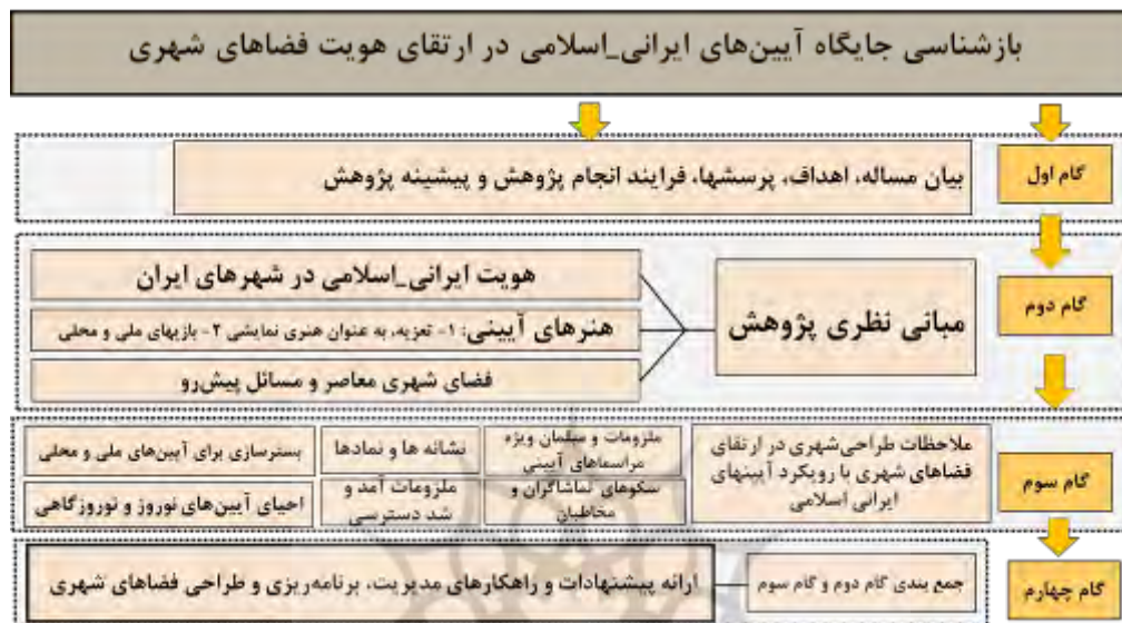
شکل ۱- نمودار فرایند انجام پژوهش

روستاهای ایرانی است که با رویکرد کیفی تحقیقی و روش تحقیق توصیفی-تحلیلی و مطالعه نمونه‌های موردی و استفاده از شیوه‌ها مطالعه کتابخانه‌ای، مشاهده، عکاسی و ... انجام شده است. بنابراین با هدف بازشناسی رابطه مابین هویت فضای شهری و هنرهای آیینی، فرض اولیه این تحقیق این است که فضاهای شهری بایستی با تامین