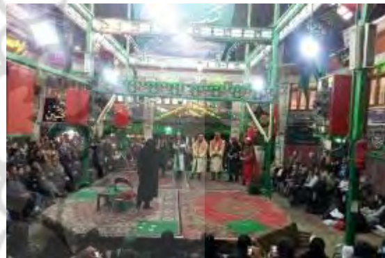
شکل ۱۲- تکایا محلی برای برگزاری مراسم های آیینی؛ تکیه تجریش (سمت راست) تکیه نیاوران (سمت چپ)