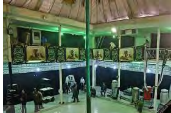
تکایا محل برگزاری مراسمات آیینی و مذهبی: تکیه نفرآباد