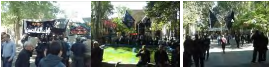
شکل ۱۵- نظم و پویایی فرهنگی و اجتماعی؛ مراسم پخش نذری و احسان در سرای امیر در ایام محرم ۱۳۹۵