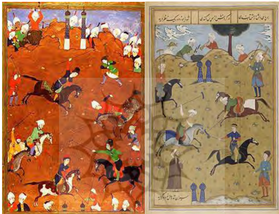
شکل ۷- دو اثر نگارگری که بازی چوگان را نمایش می‌دهد

زهرکس شنیدم که چوگان تو سیاوش بدو گفت فرمان تراست سواران و میدان و چوگان تراست (شاهنامه فردوسی، ۴۳۲۶) به میدان خرامید خود با وزیر (شاهنامه فردوسی، ۴۹۰) جهان جوی با گوی و چوگان و تیر