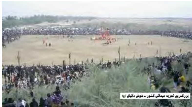
بزرگترین تعزیه میدانی کشور - شوش - آنیال (ع)