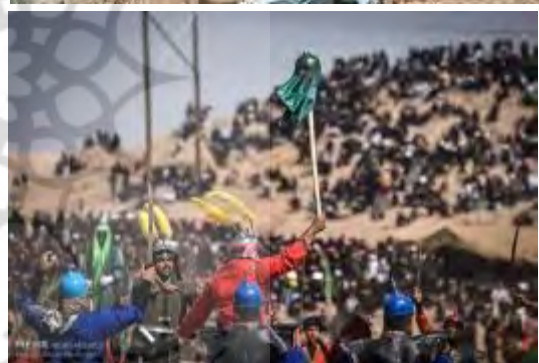
شکل ۶- تعزیه صحرا رود شهرستان فسا با ۲۵۰ سال قدمت از تاثیرگذارترین تعزیه های کشور محسوب می شود که در سال ۱۳۹۱ با شماره ۶۵۶ در فهرست میراث معنوی کشور ثبت شده است. شهرستان فسا در ۱۳۰ کیلومتری جنوب شرقی شیراز واقع شده است

فرهنگ بازی های این دوره بوده است. مغولان پس از حمله به ایران و در زمانی که با فرهنگ و هنر ایران آشنا می شوند چوگان بازی را نیز یاد گرفته و در سراسر امپراطوری وسیع خود رواج می دهند. چوگان در دوره صفویه به شکوفایی رسید. اسناد تاریخی نشان داده اند که شاه عباس چوگان باز بوده است و حتی پیش از اینکه به اصفهان بیاید در قزوین که پایتخت ایران بوده چوگان بازی می کرده است. همچنین میدان نقش جهان اصفهان برای چوگان بازی بنا نهاده شده بود. اروپاییان در زمان صفویان و در زمان استعمار خود در هند، با این بازی آشنا شدند و افسران انگلیسی نیز به طور حرفه ای چوگان را در باشگاه کلکته