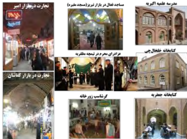
شکل ۱۳- مراکز و فضاهای فرهنگی، مذهبی، اقتصادی و اجتماعی بازار تبریز (ماخذ: نگارنده).

قرار می‌گیرد، به روضه‌خوانی پرداخته و نذر واحسان کسبه تیمچه با پذیرایی از عزاداران (صبحانه، چای، خرما و ...) انجام می‌شود.