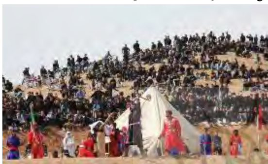
شکل ۵- تعزیه میدانی در شوش دانیال (ع)