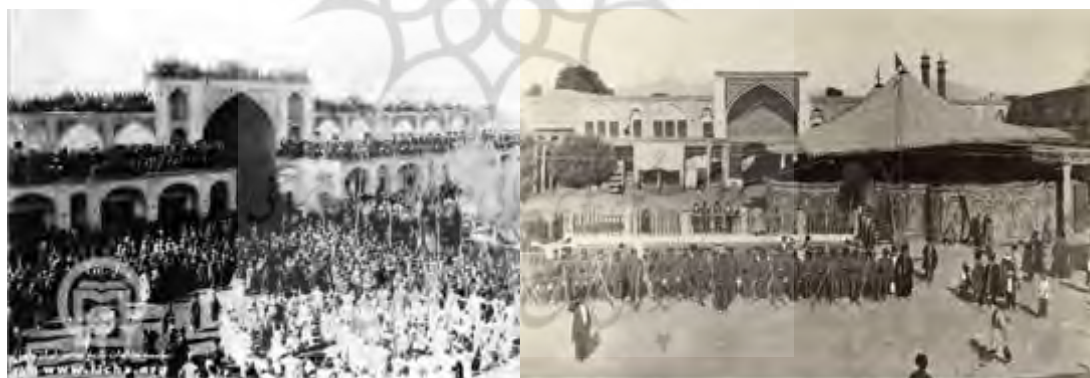
شکل ۹- سبزه‌میدان تهران؛ برگزاری مراسمات دولتی و مذهبی در گذشته

شکل فضاهای شهری می‌بایست با توجه به نوع آیین و مراسم آیینی با آن متناسب باشد. فضاهای شهری مرکزگرا مانند کاروانسرا، میدان و میدانچه و سبزه‌میدان با