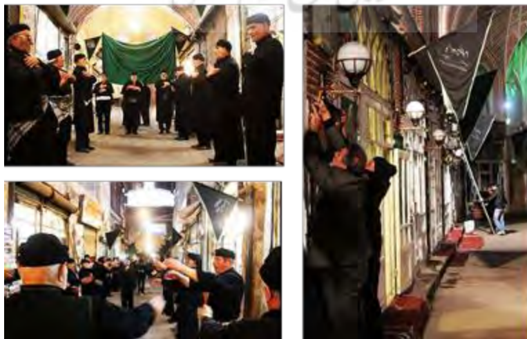
شکل ۱۱- تیمچه مظفریه بازار تاریخی تبریز محلی مهیا و پذیرا برای برگزاری مراسم‌های مذهبی و آیینی

نشانه‌ها و نمادها: نشانه و نماد در تعزیه کاربرد زیادی دارد چنان‌که گفته‌اند این نمایش باغی از نشانه و نماد است. انواع پرچم‌های سبز، سرخ و سیاه که نماد اهل بیت ، شور و انقلاب و سوگواری‌اند، علم که نماد درفش سپاه حسین بن علی است، تشت آب به نشانه شط فرات ؛ شاخه نخل یا هر نهالی به نشانه نخلستان و درخت؛ چرخش به دور خود و راه رفتن به گرد صفحه به علامت گذشت زمان و همچنین مسافرت؛ چتر که وسیله القای تازه فرود آمدن هر ولی یا فرشته به‌ویژه جبرئیل از آسمان است؛ زدن عینک سفید برای نشان دادن روح بصیرت و نیکدلی و عینک دودی برای جلوه خباثت و بدسگالی؛ عصا که نشانگر تجربه و مصلحت‌اندیشی است؛ نگریستن گاه و بی‌گاه از میان دو انگشت بزرگ دست برای تأکید بر قدرت و فضیلت اولیا در تجسم اوضاع آینده و همچنین پیش‌بینی؛ بر تن کردن نیم‌تنه بلند سفید ( کفنی ) به نشانه نزدیک شدن مرگ و اعلام جانبازی ؛ زدن یا افشاندن اندکی کاه بر سر برای نشان