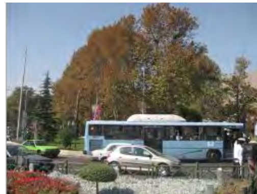
شکل ۸- فضاهای شهری معاصر در اسارت سواره؛ میدان تجریش، جزیره سبز میانی در تسلط سواره

فراهم آوردن فضایی مرکزی امکان تجمع و گردهمایی را بخوبی فراهم می‌آورند. فضاهای خطی نیز مانند گذرها و بازارها با فراهم آوردن مسیری مناسب برای دسته‌های عزاداری و آیین‌های حرکتی فضای مناسب برای حرکت و مکث را ارائه می‌دهند. بطور کلی ویژگی‌های این نوع فضاها را می‌توان به شرح زیر تبیین نمود