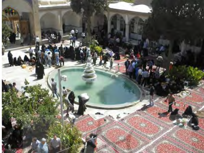
تصویر شماره ۵: باغ آرامستان شاهزاده هادی فین

۴. الگوی باغ ایرانی: باغ ایرانی یکی دیگر از الگوهای رایج در طراحی آرامستان است که ابعاد گوناگون هویتی، معنایی، کارکردی و اجتماعی آن در ایجاد یک فضای موفق یادمانی و زیارتی نقش دارد. همنشینی مفهوم باغ ایرانی با تصویر باغ بهشت، در کنار تأکید و تقویت عناصر طبیعی و ارزش این عناصر در فرهنگ و آیینهای ایرانی-اسلامی، فضایی نمادین را به وجود میآورد که در عین برخوردار بودن از هویت آیینی و معنوی، امکان ارتباط با طبیعت در فضایی زیبا، خرم و سرزنده را به وجود میآورد و به عنوان یک فضای فراغتی و تفرجگاهی در شهر ایفای نقش میکند. ایجاد فضایی دنج برای تأمل فردی در کنار وسعت فضای طبیعی که کارکرد گردشگری را با ابعاد کارکردی زیارتی و یادمانی فضا میآمیزد به رونق این فضاها کمک کرده است؛ در حالی که حضور مقابر در این مجموعه ضامن جهتگیری فرهنگی و روحیه حاکم بر فضاست. به لحاظ عملکردی نیز باغ ایرانی با توجه به سنتهای اجتماعی، فضایی مناسب برای گذران اوقات فراغت و تعامل با دیگران بوده است. تفرج در دامان طبیعت و زیر سایه درختان منظر مثالی برای شاعران ایرانی بوده که با سنت زیارت اهل قبور و گردشگری آیینی پیوند خورده است. همچنین الگوی باغ، با ایجاد فضاهای باز وسیع برای برگزاری مراسم جمعی انطباق مناسبی با عملکردهای مرتبط با آرامستان دارد (مسعودی اصل و همکاران، ۱۳۹۵: ۱۲۳).