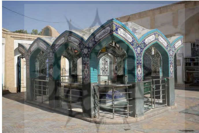
تصویر شماره ۳: آرامگاه علامه فیض کاشانی

۲. الگوی آرامگاهی: گفته میشود بناهای یادمانی ملهم از نخستین مقبرهها هستند (مالصالحی، ۱۳۹۴). ساخت بناهای مقبره‌ای در معماری ایران دارای پیشینه‌ای غنی و طولانی است. استفاده از فرمهای چهارطاقی و یا برج مانند و تکاملی این طرحها به صورت بناهایی شاخص و نمادین، از مهمترین الگوها در طراحی آرامگاهها به شمار میرود. مهمترین ویژگی این الگو که در معماری آرامگاههای مشاهیر و مفاخر دیده میشود، فرم شاخص آنهاست که بازتاب جلال، عظمت و استواری بوده و به عنوان عنصر نشانه در منظر نقش دارد