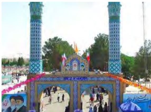
تصویر شماره ۴: آرامستان دارسلام گلابچی

۳. الگوی فضای عمومی شهری: طراحی آرامستان به عنوان یک فضای جمعی چند عملکردی که کارکردهای مختلف را در خود دارد و پاسخگوی نیازهای متنوع شهروندان باشد، رویکردی دیگر در طراحی این فضاهاست. جانمایی این فضاها در ارتباط نزدیک با فضاهای جمعی پررونق، تلفیق با بافت شهری اطراف از طریق حذف لبه‌ها و سرایت معابر به درون مجموعه و وسعت فضا که امکان گردهمایی و حضور گروههای مردم را فراهم میکند و در عین حال فضاهای سیال و چند عملکردی را به وجود می‌آورد، سبب ایجاد فضاهای فعال و زنده شهری شده که مقابر را در ارتباط با زندگی روزمره مردم قرار میدهد. ویژگی اصلی اینگونه از ساماندهی، ارتباط قوی با زندگی جاری در شهر و رونق فضا با ایجاد فضای عمومی شهری است. در واقع مهمترین ویژگی این الگو، پذیرش کارکردهای متنوع و فراهم کردن یک فضای شهری چند عملکردی است که به تبع زمینه ایجاد ارتباط با مخاطب و زندگی روزمره او، شکل‌گیری خاطرات جمعی و تقویت ماندگاری فضا در ابعاد ذهنی را به همراه خواهد داشت.