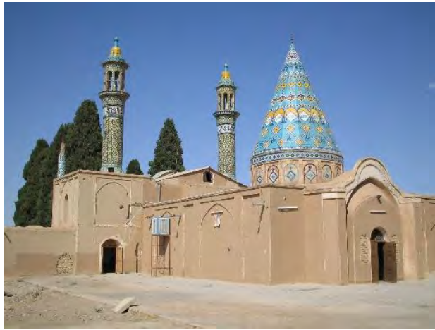
تصویر شماره ۲: بقعه شاهزاده ابراهیم کاشان

۲. الگوی آرامگاهی: گفته میشود بناهای یادمانی ملهم از نخستین مقبرهها هستند (مالصالحی، ۱۳۹۴). ساخت بناهای مقبره‌ای در معماری ایران دارای پیشینه‌ای غنی و طولانی است. استفاده از فرمهای چهارطاقی و یا برج مانند و تکاملی این طرحها به صورت بناهایی شاخص و نمادین، از مهمترین الگوها در طراحی آرامگاهها به شمار میرود. مهمترین ویژگی این الگو که در معماری آرامگاههای مشاهیر و مفاخر دیده میشود، فرم شاخص آنهاست که بازتاب جلال، عظمت و استواری بوده و به عنوان عنصر نشانه در منظر نقش دارد