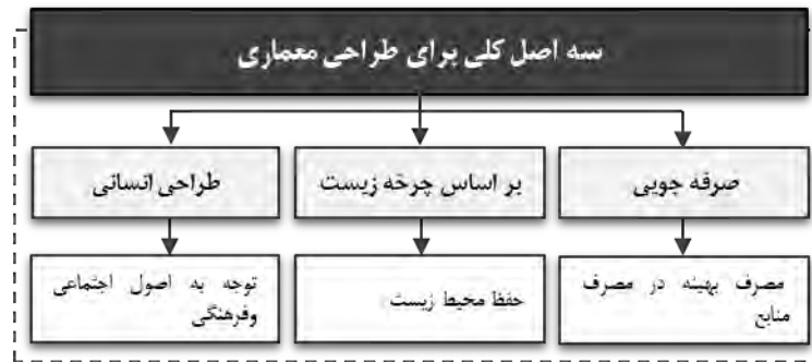
دیاگرام ۴. اصول طراحی معماری

نتایج فراوانی از تحقیق و تفحص در طبیعت می‌توان به دست آورد. مدیران و طراحان با کمک بیولوژیست‌ها باید اصول طرح و برنامه‌های جهان بیولوژی را پیدا کنند که این‌یک همکاری بین رشته‌های مختلف علوم و یک علم بین‌رشته‌ای است که درک مدیران و طراحان را از طبیعت و چگونگی عملکرد آن‌ها افزایش می‌دهد و موجب کشف راه‌حل‌های نوآورانه در زمینه‌های طراحی می‌شود و سه راهبرد کلی مطرح می‌شود.