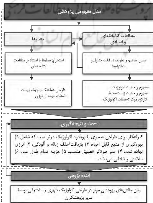
دیاگرام ۱. مدل مفهومی پژوهش

این پژوهش از نوع بنیادی و در پی ارتقاء سطح دانش و آگاهی است فلذا با روش تحقیق آن به‌صورت ترکیبی است به این معنا که اجازه می‌دهد تا مباحث حول روش جمع‌آوری داده‌ها در یکدیگر ادغام شوند، به همین خاطر در بخش نخست باهدف تبیین مفاهیم و ماهیت واژگان کلیدی و با بهره‌گیری از مطالعات کتابخانه‌ای و اسنادی نگاه مختصری به ماهیت طراحی اکولوژیک و زیست‌محیطی داشته، و در لوای راهکارهای طراحی یک مرکز تحقیقاتی زیست‌محیطی ارائه می‌شود، به‌این ترتیب برای جمع‌بندی و اختصار گفتار در ادامه مدل مفهومی پژوهش ارائه می‌شود.