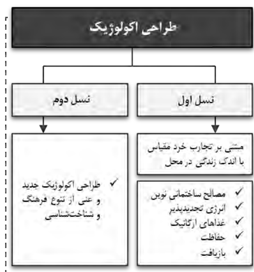
دیاگرام ۳. طراحی اکولوژیک