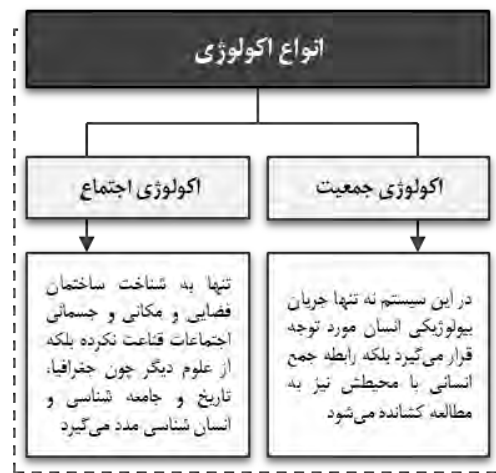
دیاگرام ۲. انواع اکولوژی (منبع: نگارندگان ۱۳۹۹)