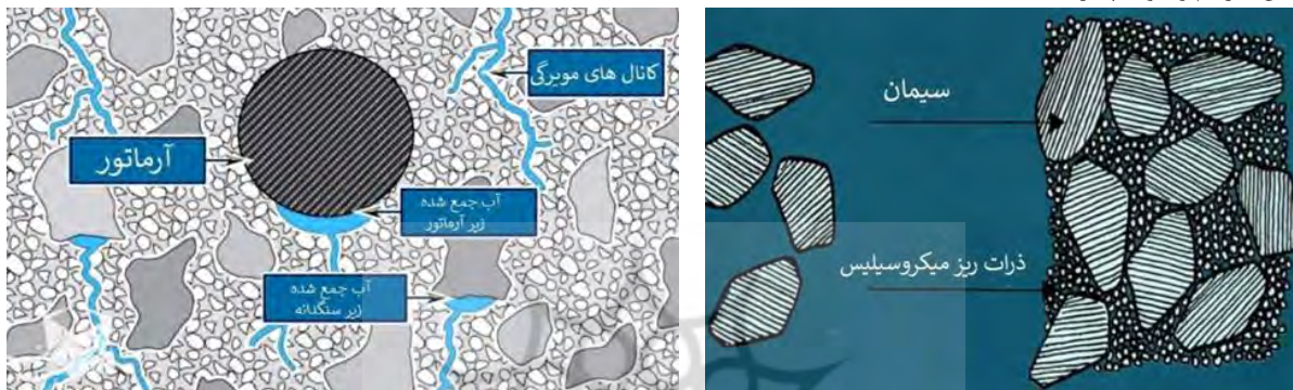
شکل ۲- کارکرد میکروسیلیس در عملکرد و دوام بتن.

به طور کلی اثرات استفاده از میکروسیلیس در بتن را می‌توان در کاهش نفوذپذیری، افزایش مقاومت فشاری و خمشی و کششی، افزایش مقاومت بتن در برابر فرسایش، جلوگیری از نفوذ یون کلر، سولفات‌ها و سایر مواد شیمیایی مخرب به داخل بتن، کاهش حرارت هیدراتاسیون، تاخیر در واکنش قلیایی دانه‌ها، تاثیر کمتر سیکل یخ و ذوب آب و افزایش پیوستگی بتن خلاصه نمود (همان). همچنین استفاده از میکروسیلیس موجب مسدود شدن کانال‌های مویری تعریق بتن میگردد.