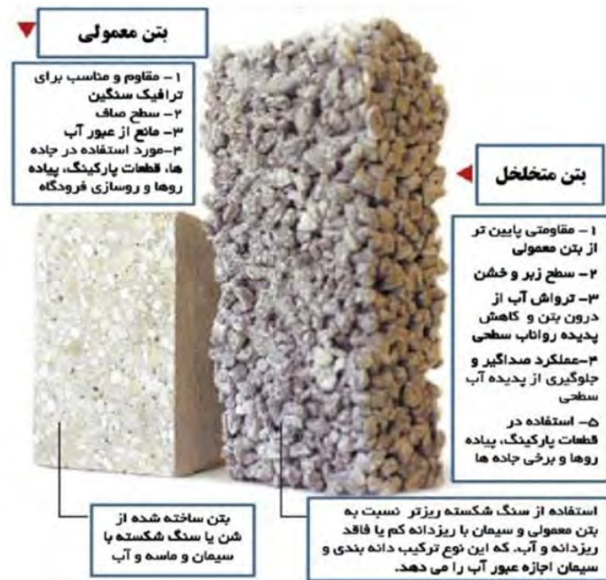
شکل ۴- مقایسه بتن معمولی در مقابل بتن متخلخل (منبع: شیرگر و همکاران، ۱۳۹۴)

بنابراین در کاربرد وسیع این نوع از بتن، تقاضای بتن نفوذپذیر با مقاومت و دوام بالا رو به افزایش خواهد بود. متأسفانه به دلیل تخلخل بالا و مقدار کم ملات سیمان، بتن نفوذپذیر در مقایسه با بتن معمولی از مقاومت کمتری برخوردار است (Chen, et al. ۲۰۱۳). بتن نفوذپذیر شامل ترکیبی از یک مقدار کنترل شده از خمیر سیمان، دانه بندی سنگدانه با اندازه ذرات یکنواخت و توزیع بار یک اندازه ذرات، با ماسه بسیار اندک و در شرایطی بدون ماسه است (Chen and Zhang, ۲۰۰۹ and Marolf, et al. ۲۰۰۴ and Park, Seo and Lee, ۲۰۰۵).