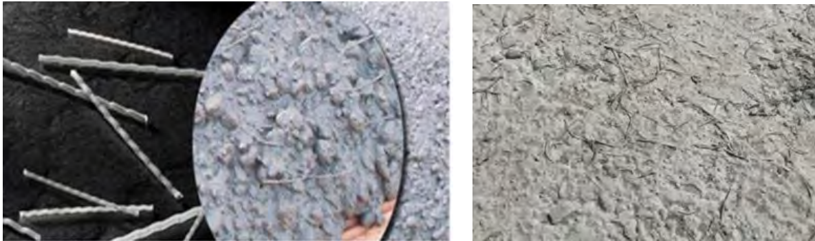
شکل ۵- بتن الیافی

در واقع استفاده از بتن الیافی می تواند در ساخت و یا تعمیر سدها و هرگونه سازه هیدرولیکی مورد استفاده قرار گیرد که به وسیله آن می توان مقاومت سازه را در برابر کاویتاسیون و همچنین در برابر خوردگی های جدی که بر اثر ضربه های حجم آب به وجود می آید، افزایش داد.