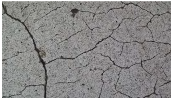
شکل ۱- ترک خوردگی بتن

به عنوان یک مثال ملموس از تاثیر فشار هیدرولیکی بر روی مقاومت بتن، می توان به پدیده ترک خوردگی سدهای بتنی اشاره کرد که خود می تواند ناشی از عوامل متعددی از جمله خوردگی آرماتورها در بتن باشد. خوردگی آرماتورها در بتن ناشی از نفوذ رطوبت و حضور اکسیژن به همراه کلر یا کربناسیون می باشد. یکی از متداول ترین آسیب ها در این زمینه، ترک خوردگی پاشنه سد است که در پی فشار هیدرولیکی سبب تنش های کششی شده است. از سوی دیگر پیشروی این دسته از ترک ها روی سازه های هیدرولیکی زمانی تسریع می شود که ترک خوردگی تاثیر قابل ملاحظه ای بر روی میدان تنش در اطراف ترک داشته باشد. توزیع فشار آب در ترک به وجود آمده نیز از عواملی است که حتما باید مورد بررسی قرار گیرد. مقاومت بتن در برابر فشاری که به آن وارد می شود نه تنها مرتبط با نوع تنشی است که به متریکال بتنی وارد شده است، بلکه به چگونگی ترکیب موادی که موثر در ایجاد تخلخل اجزای بتنی می شود نیز بستگی دارد (میری و همکاران، ۱۳۹۳).