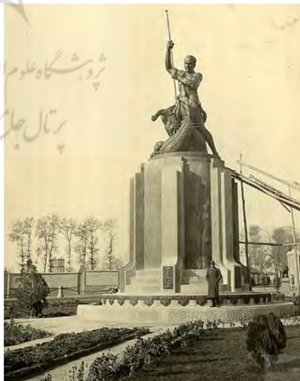
تصویر ۲. عکسی برداشت‌شده از میدان حر فعلی تهران که تاریخ آن (۱۴/۱۰/۱۲) در پشت عکس مشهود است.