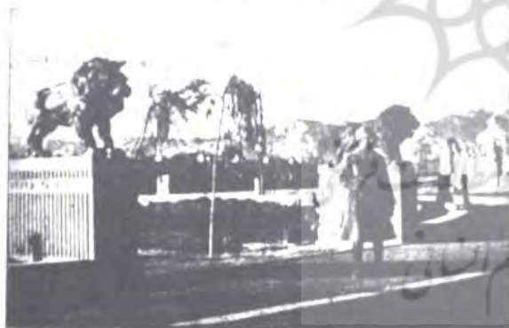
در اسناد حیاتی به میدان خلوی باغ شاه

عدم وجود بانک اطلاعاتی از مجسمه های میدان تهران که برای بررسی تاریخی از ضروریات است از یک سو و مواجهه با ثبت تاریخ های متفاوت از یک اثر به ویژه مجسمه میدان حر از سوی دیگر، نگارنده را در راستای انجام رساله دکتری خود با عنوان «زیبایی شناسی مجسمه های شهری تهران در دو دهه اخیر (۱۳۶۹ تا ۱۳۸۹)» ترغیب داشت به توصیفات موجود در سفرنامه ها، روزنامه ها و جراید دوران گذشته که اتفاقاً اسناد مهمی برای کسب اطلاعات مجسمه ها محسوب می شوند، جهت اطلاع از تاریخ نصب مجسمه ها رجوع کند. بازتاب اتفاقات در خصوص مجسمه های شهری که از مظاهر مدرنیسم به شمار می رفت، یکی از اخبار مهم جراید وقت دوران پهلوی به شمار می رود. در این راستا، روزنامه اطلاعات