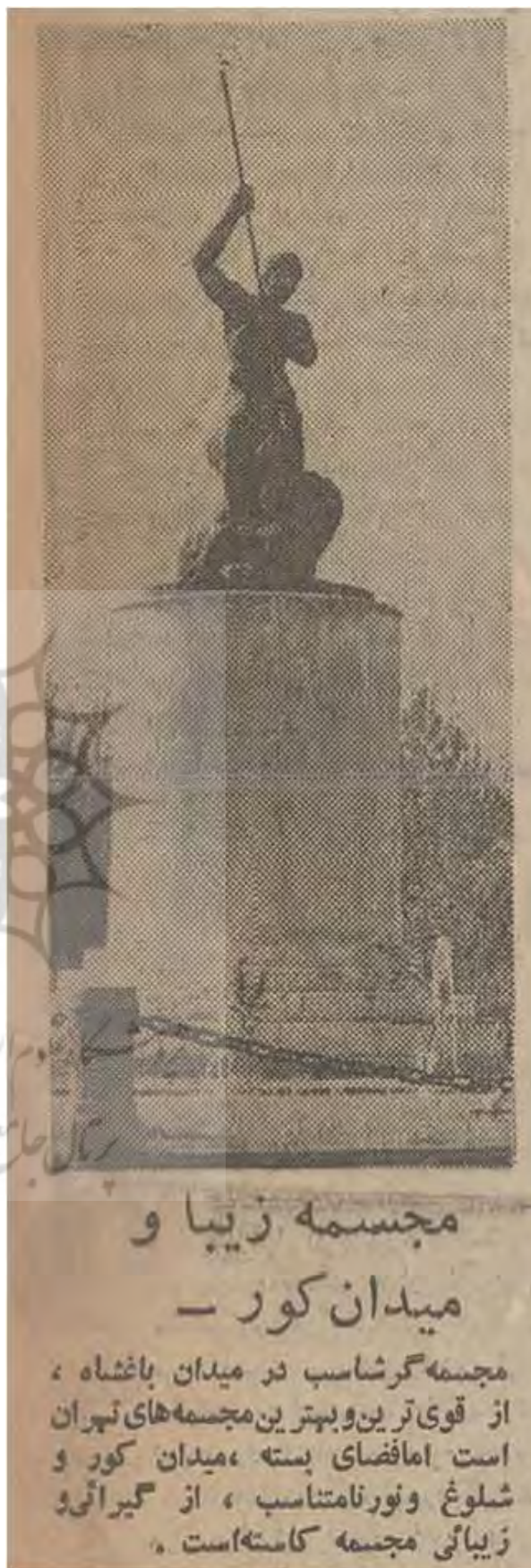
تصویر ۵. تصویر مجسمه با اطلاق نام مجسمه‌گرشاسب در روزنامه اطلاعات.