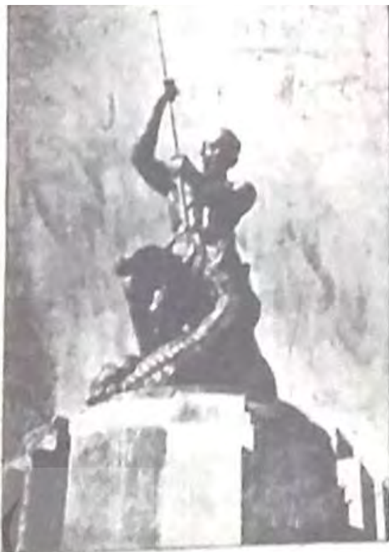
مجسمه سوم اسفند در میدان سوم اسفند (میدان جاری باغ شاه)

شهردار امروز طی گفتگویی با خبرنگاران گفت: چند خانه واقع شده در مسیر این امتداد تا پایان سال بوسیله شهرداری تخریب شده و پس از انتقال صاحبان آنها به خانه های جدید، ساختمان خیابان شروع خواهد شد. شهردار اظهار داشت که ترافیک سی متری و آیزنهاور سرسام آور شده و برای آسوده کردن ترافیک این دو خیابان میبایست طرح امتداد سپه به مرحله اجرا درآید. طرح جدید شهرداری از قسمت غربی میدان باغشاه و مجسمه معروف گرشاسب پهلوان افسانه ای ایرانی که در وسط این میدان نصب گردیده به مرحله اجرا در می آید.