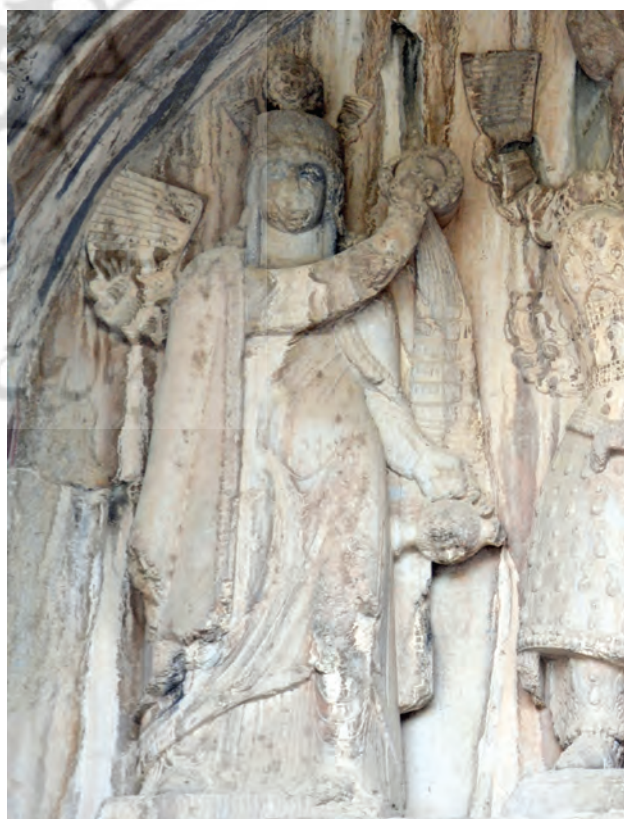
تصویر ۷. ایزدبانو آناهیتا در نقش برجسته تاق بستان با تاجی از مروارید به همراه کوزه آب.