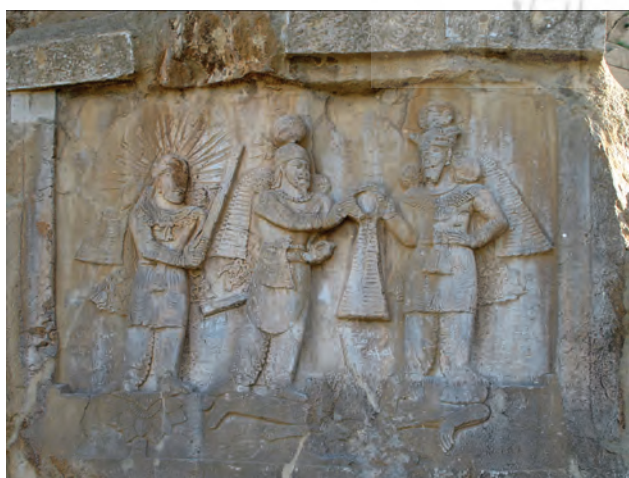
تصویر ۸. تاج‌گیری اردشیر دوم از اهورامزدا با حضور ایزد مهر-میترا.