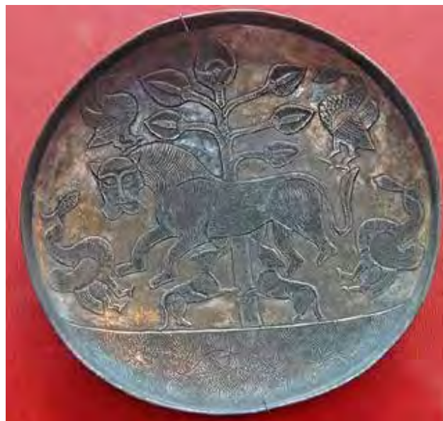
تصویر ۲. ظروف ساسانی با نقوش گیاهی.