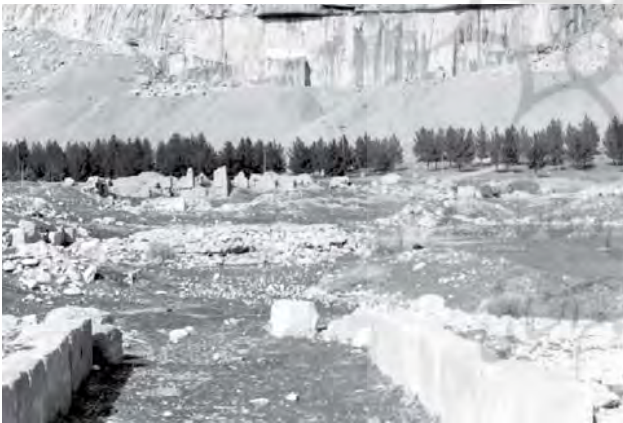
تصویر ۱۱. صفت فرهادتراش.