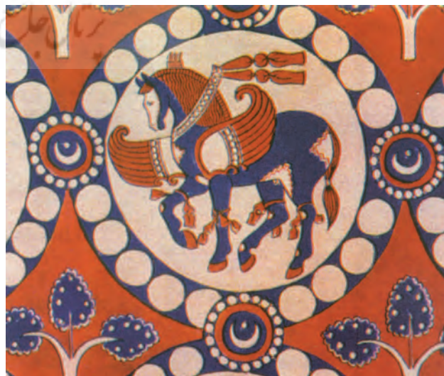
تصویر ۳. نقش اسب و بز با دیهیم و گردنبند مروارید بر پارچه ساسانی.