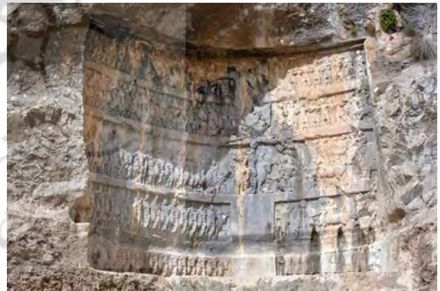
تصویر ۱۰. نقش برجسته تنگ چوگان.