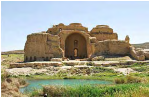
تصویر ۱. کاخ اردشير، فیروزآباد-فارس.

با نقش برجسته‌هایی از ایزدان مهر، آناهیتا و اهورامزدا در صحنه‌های تاج‌ستانی و شکار شاه به انواع نقش و نگارها و نمادهای طبیعی آراسته شده‌اند. مجموعه این بناهای مذهبی-حکومتی در دل صخره‌های شکوهمند و مقابل چشمه‌ای جوشان واقع شده که درختان کهنسال گرداگرد آنان را دربر گرفته و باغ معبد و شکارگاه شاه را تقدس بخشیده است. نیایش، تاجگذاری و شکار از رسوم و آیین‌های باشکوه شاهان ساسانی بوده که بر سنگ‌نگاره‌هایشان ثبت کرده‌اند. سی و چهار صحنه از نقش برجسته‌های ساسانی در ارتباط با طبیعت از اسناد مهم و باارزش حکومت مذهبی-سیاسی این دوران است که ردپای دین و باورهای طبیعت‌گرای آنان را آشکار ساخته است.