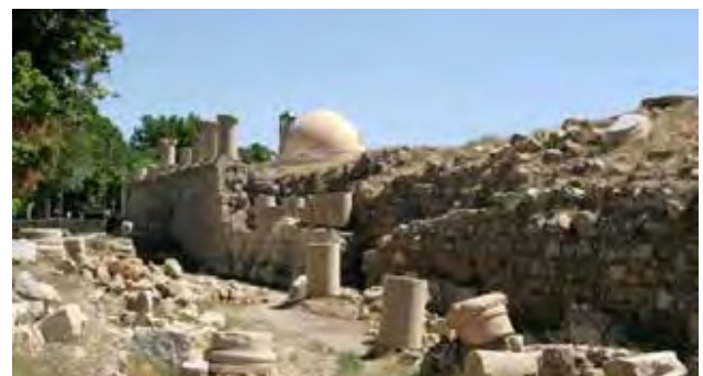
تصویر ۱۲. معبد آناهیتا، کنگاور.