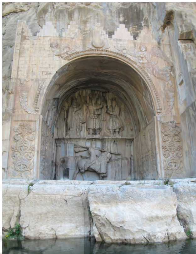
تصویر ۶. تاق بستان.

در گذشته آبی در این مکان جاری بوده و امروز حمام و مسجدی در نزدیکی این مکان وجود دارد که نشان می‌دهد از گذشته تا کنون مکانی محترم بوده و مجاورت آن با آب، ارتباط با آناهیتا، الهه باروری و نگهبان آب‌ها را آشکار می‌سازد. از این مکان با تعلق به دوران اشکانی-ساسانی به عنوان شکارگاه نیز یاد شده است. البته مغایرتی بین شکارگاه و نیایشگاه نیست، زیرا در زمان ساسانی هر دو در کنار هم وجود داشته‌اند. چنانکه