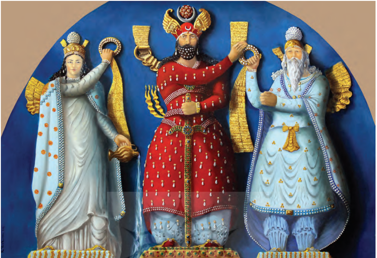
تصویر ۹. نقوش لباس شاهان و ایزدان ساسانی.