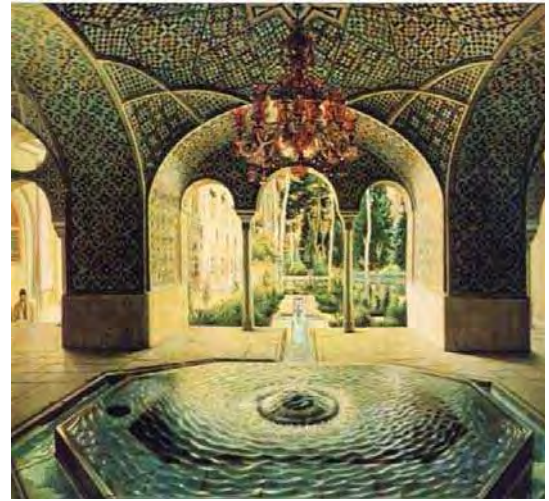
تصویر ۷. حوضخانه عمارت گلستان اثر کمال الملک. ۱۳۶۸ خورشیدی. محل نگهداری: کاخ موزه گلستان.

در این برهه از زمان علاقه به سبک‌های اروپایی در دربار رو به افزایش بود و باعث ارتباطات نزدیک دربار و اروپا شد و تأثیرات عمیقی بر ساختار محتوای تولید و آموزش هنر در ایران بود (کریم زاده، ۱۳۷۶: ۲۶-۲۵). تاسیس دارالفنون و تدریس این سبک در آن و همچنین حمایت دربار باعث رشد و پیشرفت چشمگیر آن شد. از نظر مریم اختیار نقش صنایع الملک در راه‌اندازی اولین کلاس‌های نقاشی بسیار موثر بود؛ به ویژه در چهره‌پردازی به صورت رئالیستی بسیار به سبک اروپایی نزدیک شد. از نظر مریم اختیار برای مدرسان تدریس در دارالفنون مجموعه شرایطی در نظر گرفته شد شرط اساسی آن آگاهی از قوانین نقاشی آکادمیک اروپایی و مهارت در استفاده از تجهیزات جدید بود (Ekhtiar, 1999: 57).