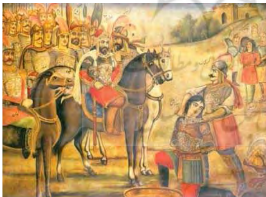
تصویر ۵. نقاشی قهوه خانه ای موضوع: کشته شدن سیاوش اثر حسن اسماعیل زاده. محل نگهداری موزه رضا عباسی

گیری دورگه در این فضا دانست. به تدریج به جای عناصر به هم پیوسته مکتب اصفهان را عناصر غیر ایرانی می گیرد. در جدول شماره ۱ بررسی عناصر نقاشی ایرانی و اروپایی در آثار فرنگی سازی صورت پذیرفته است.