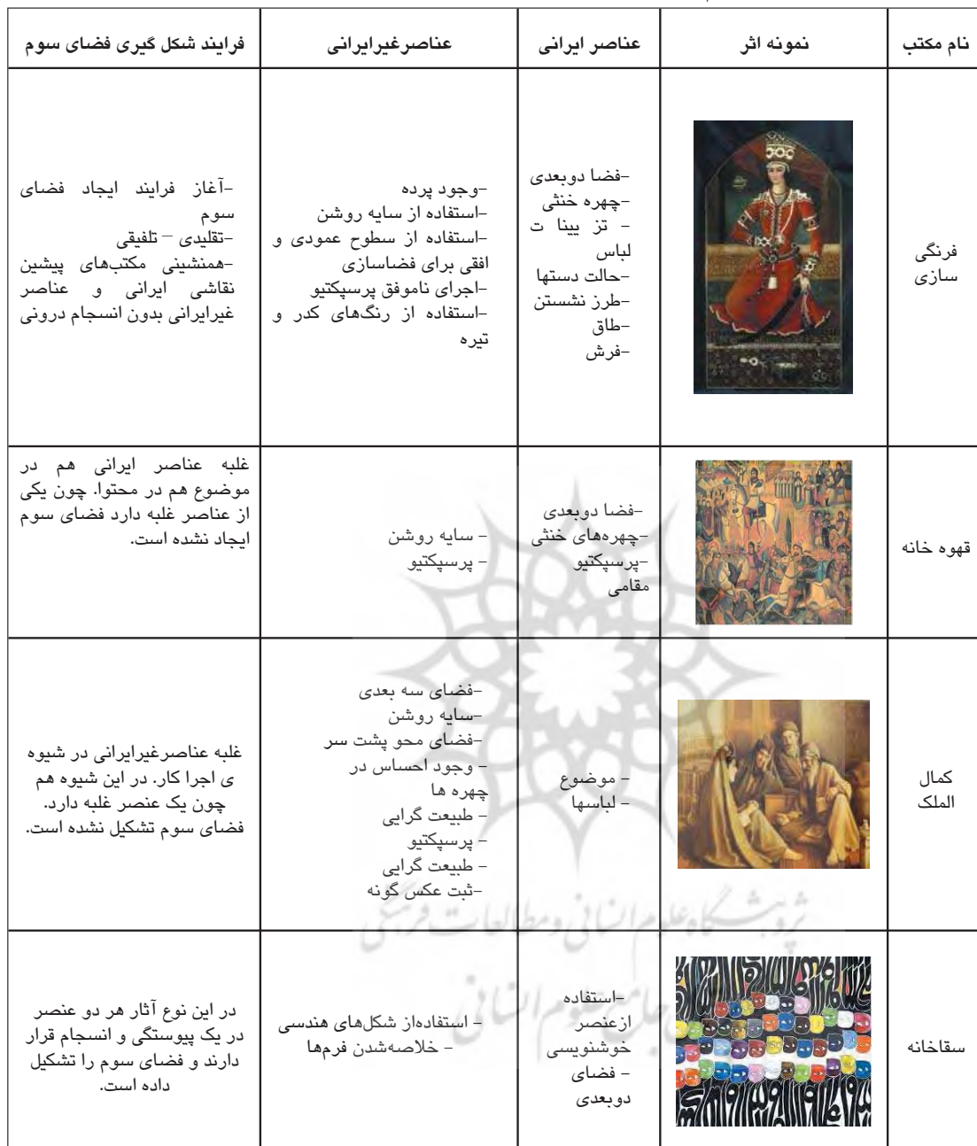
جدول ۲. فرایند شکل‌گیری فضای سوم هومی بابا در نقاشی معاصر ایران

که مکاتب کوبیسم و اکسپرسیونیسم پذیرفته بودند، در انجمن‌هایی از جمله خروس جنگی و نگارخانه آدادانا با حضور آنان نوعی برخورد میان گرایش‌های کهنه و نو ایجاد شد و با برپایی نخستین دوسالانه تهران در سال ۱۳۳۷ ه.ش با نمایش آثار نوگرایان این جنبش به رسمیت شناخته شد (پاکباز، ۱۳۸۳: ۲۰۵-۲۰۶). در دهه ۱۳۳۰ هنرمندانی با استفاده از گنجه‌های هنرهای تزئینی عامیانه و خوشنویسی فارسی به عنوان عناصری از هنری ایرانی سعی بر حفظ هویت هنری داشتند. آنان می‌خواستند