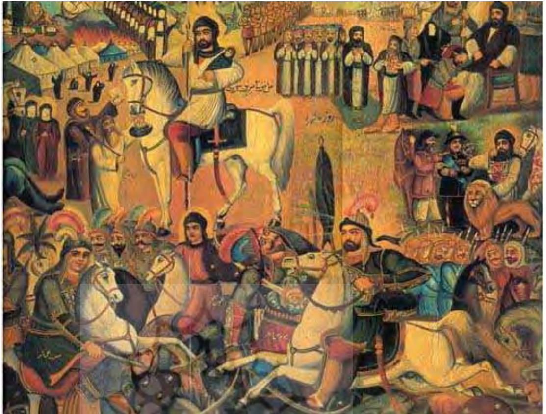
تصویر ۴. نقاشی قهوه خان های با موضوع عاشورا، اثر حسن اسماعیل زاده