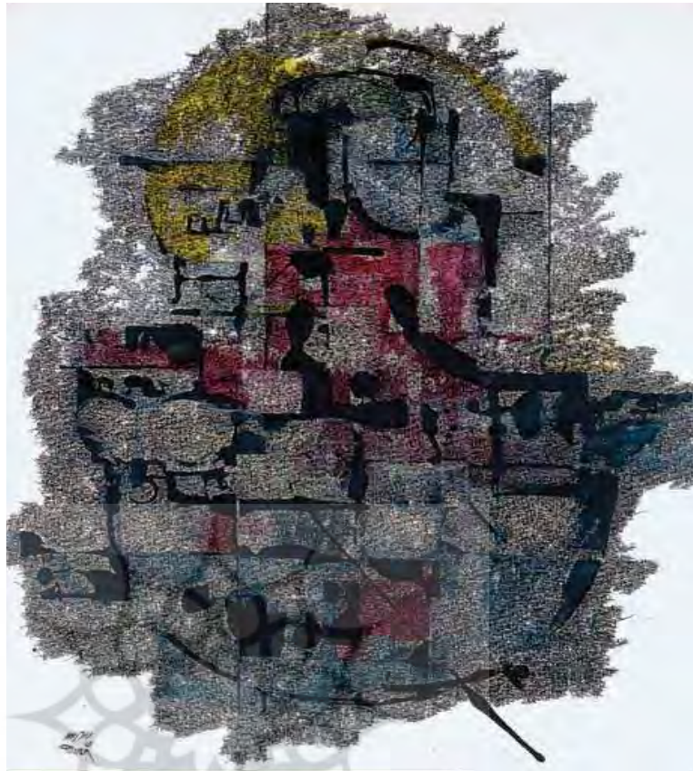
تصویر ۹. نقاشی خط. بدون عنوان. اثر: فرامرز پیلارام.

هر دو طرف در آن ادغام شده‌اند و وجودی سرتاسر تازه ایجاد کرده است. در این آثار عنصر حروف و یا خوشنویسی به عنوان یک عنصر شاخص از هنر ایرانی است که توانسته است با عناصر برگرفته از اروپا دورگه گی را به انسجام برساند.