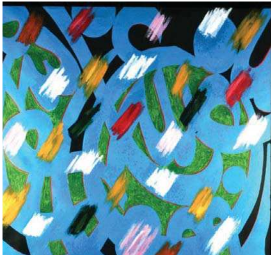
تصویر ۸. اثر حسین زنده رودی