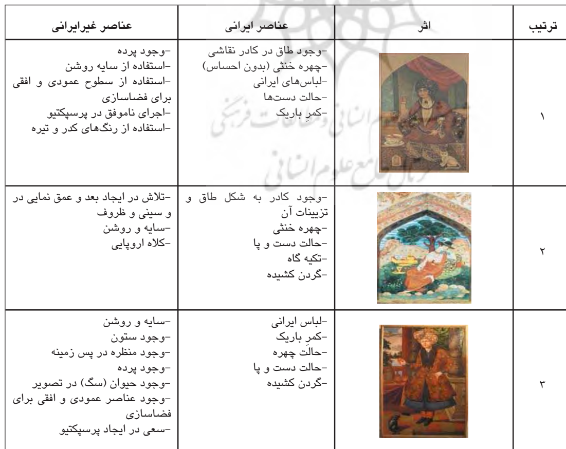
جدول ۱. بررسی نمونه‌های نقاشی فرنگی سازی، مأخذ: نگارندگان

در عهد شاه عباس اول و جانشینانش پای اروپاییان به ایران باز شد و تأثیرات خود را بر هنر ایران برجای گذاشت. از سوی دیگر، ارتباط با هند و حضور ارمنیان در جلفا عوامل دیگر تأثیرگذار بودند. از اوایل سده ۱۷م/۱۱ق ارتباط سیاسی و مبادله تجاری وسیعی میان ایران و کشورهای دیگر برقرار شد. در این دوران شاه عباس اصفهان را پایتخت و به نوسازی آن پرداخت و جوی بین