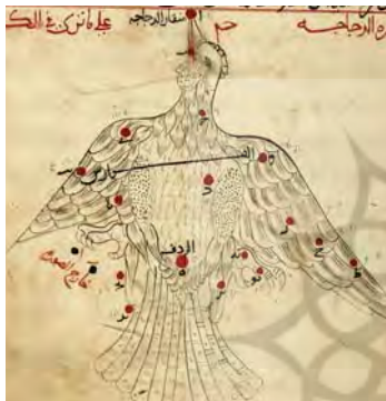
تصویر ۱۸. صورت فلکی دجاجة، صورالکواکب، کتابخانه ملی پاریس، سده هفتم هجری