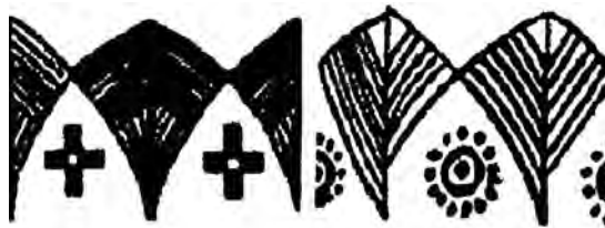
تصویر ۲. نقش خورشید بر سفالینه های پیش از تاریخ لرستان.