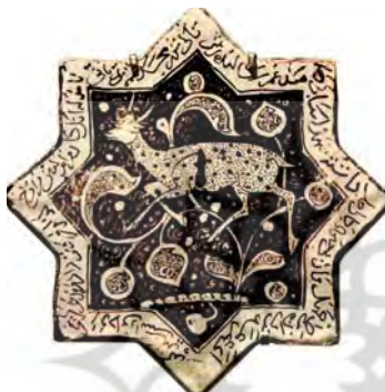
تصویر ۲۳. نقش بز روی کاشی زرین‌فام، امامزاده جعفر، دامغان، سده هفتم هجری، مأخذ: www.louvre.fr