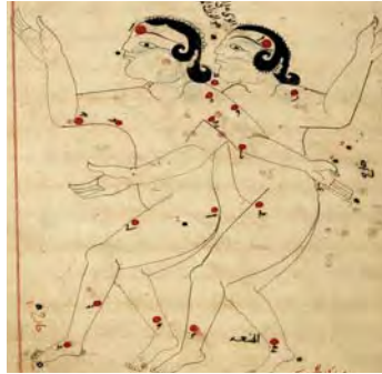
تصویر ۱۴. صورت فلکی جوزا، صورالکواکب، کتابخانه ملی پاریس، سده هفتم هجری