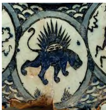
تصویر ۱۲. صورت فلکی اسد، بخشی از بشقاب آبی-سفید، دوره صفوی، موزه برلین، (بخشی از تصویر ۷)، مأخذ: www.pinterest.de