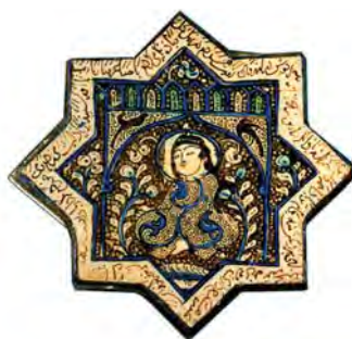
تصویر ۸. نقش زن روی کاشی زرین‌فام، امامزاده جعفر، دامغان، سده هفتم هجری