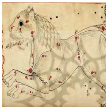
تصویر ۱۱. صورت فلکی اسد، صورالکواکب، کتابخانه ملی پاریس، سده هفتم هجری، مأخذ: www.gallica.bnf.fr