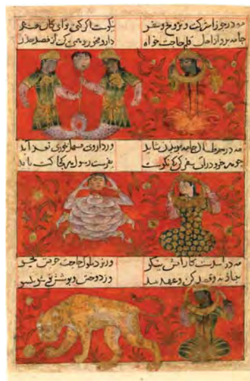
تصویر ۳. صفحه‌ای از نسخه دست‌نویس مونس الاحرار، اصفهان، ۷۴۱ هـ.ق، موزه مترو پولیتن نیویورک

خوشبختی و ناخوشی (سعد و نحس) استفاده می‌شده است (تصویر ۳) و بسیاری از فعالیت‌های روزانه‌شان را تحت تأثیر قرار می‌داده است. پندارهای کیهانی و مفاهیم نجومی در آثار هنری دوره‌های مختلف ایران مخصوصاً سده‌های پنجم تا هفتم هجری بازتاب گسترده‌ای داشته‌اند که حاکی از این است که نجوم و باورهای مربوط به آن در زندگی مردم تأثیر فراوانی داشته و در بسیاری از جوانب اقتصادی، سیاسی و اجتماعی حکومت کاربرد داشته و مورد استفاده واقع شده است. (تصویر ۴)