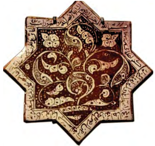
تصویر ۲۵. نقش ماهی روی کاشی زرین فام، امامزاده جعفر، دامغان، سده هفتم هجری