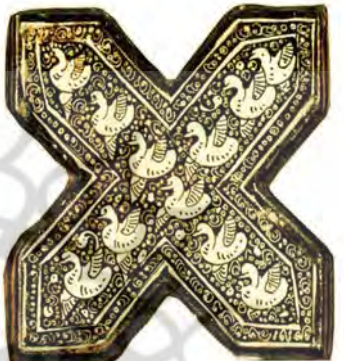
تصویر ۱۷. نقش قو روی کاشی زرین فام، امامزاده جعفر، دامغان، سده هفتم هجری