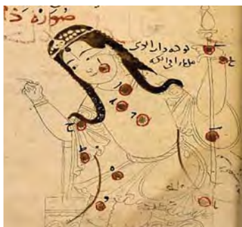
تصویر ۹. صورت فلکی ناتالکرسی، صور الکواکب، سده هفتم هجری