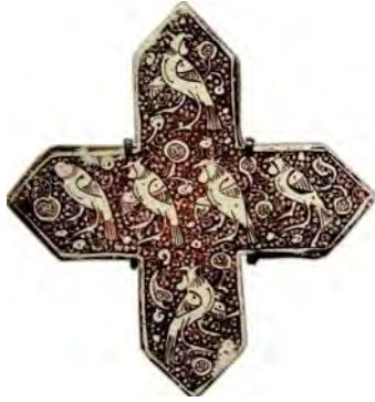
تصویر ۱۵. نقش عقاب روی کاشی زرین فام، امامزاده جعفر، دامغان، سده هفتم هجری، مأخذ: www.louvre.fr