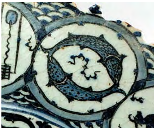
تصویر ۲۷. صورت فلکی حوت، بخشی از بشقاب آبی-سفید، دوره صفوی، موزه برلین. (بخشی از تصویر ۷).