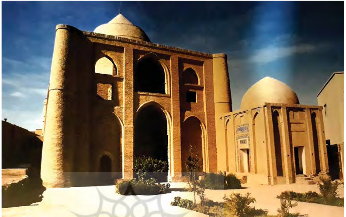
تصویر ۵. بقعه امامزاده جعفر، جبهه جنوبی، دامغان، احتمالاً سده پنجم هجری، مأخذ: حاجی قاسمی، ۱۳۸۹: ۲۷۱.

ایران است و احتمال می‌رود که محل اصلی ساخت آن‌ها کاشان باشد» (دیماند، ۱۳۸۹: ۱۹۱). در حال حاضر تعداد قابل توجهی از این کاشی‌های زرین‌فام در موزه‌های لوور پاریس و پرگامون برلین نگهداری می‌شود. بر روی برخی از کاشی‌ها سنه خمس و ستین و ستمائه (۶۶۵ هجری) نوشته شده و اثری از محل ساخت دیده نمی‌شود.