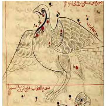
تصویر ۱۶. صورت فلکی عقاب، صورالکواکب، کتابخانه ملی پاریس، سده هفتم هجری

زن نشسته: این فیگور از مهم‌ترین نقوش صور فلکی است که نماد ذات‌الکرسی می‌باشد. ذات‌الکرسی از صورت‌های فلکی شمال است. «در بیان صورت ذات‌الکرسی، پیشینیان چنین تخیل نموده‌اند، صورت زنی را که بر کرسی نشسته و آن کرسی قائمه است مثل قائمه منبر و بر آن مسندی انداخته و بر روی مسند منبر نشسته و پای خود را آویخته» (طبری، ۱۲۶۴: ۷). ابوریحان نیز در بیان این صورت می‌گوید: «صورت ذات‌الکرسی، خداوند کرسی چون زنی نشسته بر تختی بر کردار منبر» (بیرونی، ۱۳۵۲: ۹۲). بیرونی در شرح ستاره‌ای با عنوان کف الخضیب که در این صورت فلکی واقع شده می‌گوید: «و اما آن روشن که بر منبر خداوند کرسی (ذات‌الکرسی) است او را کف الخضیب ای دست حنا بسته از دو دست پروین و گروهی مر کف الخضیب را کوهان شتر (سنام الناقه) خوانند زیرا تازیان از کواکب خداوند کرسی، اشتتری تصور کنند» (بیرونی، ۱۳۵۲: ۱۰۲). در تصویر کاشی امامزاده جعفر، زن در محلی همچون کجاوه شتر نشسته است که شاید اشاره به گفته ابوریحان بیرونی در خصوص کف الخضیب باشد. (تصویر ۱۷) جالب توجه است که در دو