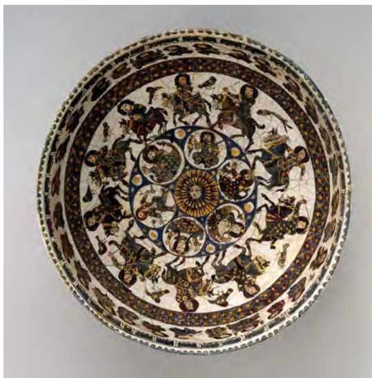
تصویر ۴. کاسه، ایران، سده پنجم هجری، موزه مترو پولیتن نیویورک

بررسی نقوش کاشی‌های زرین‌فام با موضوع صور فلکی در امامزاده جعفر دامغان (باتاکی‌دبرنسخه‌صورالکواکب قرن هفتم هجری) ۳۹۱-۵۱