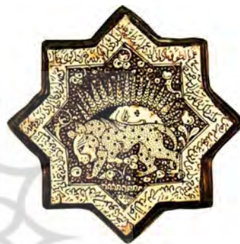
تصویر ۱۰. نقش شیر روی کاشی زرین‌فام، امامزاده جعفر، دامغان، سده هفتم هجری، مأخذ: www.louvre.fr

دیگر. نسخه‌های مصور بی‌شماری از صورالکواکب باقیمانده که هم‌اکنون در موزه‌ها و کتابخانه‌های دنیا نگهداری می‌شوند. نسخه مصوری که در این مقاله با نقوش کاشی‌های کوکبی و چلیپای امامزاده جعفر دامغان مورد تطبیق قرار گرفته: مربوط است به سال ۶۶۵ هجری که به شماره ۲۴۸۹ در کتابخانه ملی پاریس نگهداری می‌شود. این نسخه به جهت هم‌زمانی با سال‌های ساخت کاشی‌های مذکور، بهترین سند جهت بررسی و تحلیل نقوش نجومی کاشی‌ها می‌باشند.