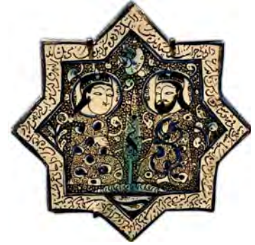
تصویر ۱۳. نقش دو پیکر روی کاشی زرین فام، امامزاده جعفر، دامغان، سده هفتم هجری، مأخذ: www.louvre.fr