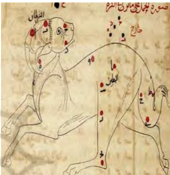
تصویر ۲۲. صورت فلکی حمل، صورالکواکب، کتابخانه ملی پاریس، سده هفتم هجری، مأخذ: www.gallica.bnf.fr

به کام تو بادا همه کار تو خداوند بادا نگه‌دار تو