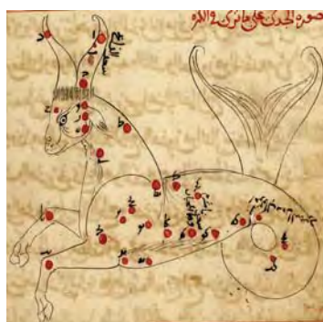
تصویر ۲۴. صورت فلکی جدی، صورالکواکب، کتابخانه ملی پاریس، سده هفتم هجری، مأخذ: www.gallica.bnf.fr