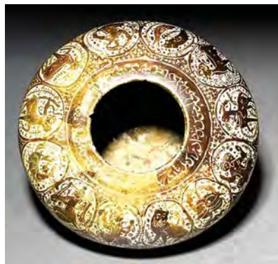
تصویر ۶. کوزه با نقش صورفلکی منطقه البروج، اواخر دوره سلجوقی

صورالکواکب معروف‌ترین اثر صوفی رازی است که وی آن را به سال ۲۵۳ هجری برای عضدالدوله دیلمی نگاشته است. عبدالرحمن بن عمر بن سهل صوفی رازی (۳۷۶-۲۹۱