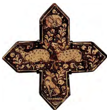
تصویر ۲۱. نقش گوسفند روی کاشی زرین‌فام، امامزاده جعفر، دامغان، سده هفتم هجری، مأخذ: www.louvre.fr

بررسی نقوش کاشی‌های زرین‌فام با موضوع صور فلکی در امامزاده جعفر دامغان (باتاکید بر نسخه صورالکواکب قرن هفتم هجری) ۳۹-۵۱