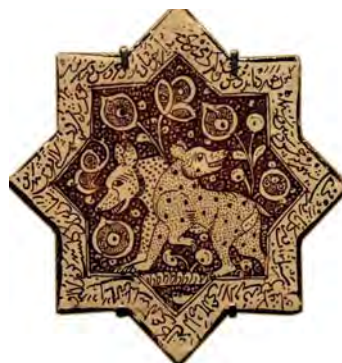
تصویر ۱۹. نقش خرس روی کاشی زرین‌فام، امامزاده جعفر، دامغان، سده هفتم هجری، مأخذ: www.louvre.fr