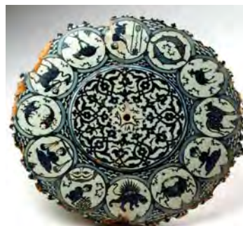
تصویر ۷. بشقاب آبی- سفید با نقش صور فلکی منطقه البروج، دوره صفوی، موزه برلین، مأخذ: www.pinterest.de