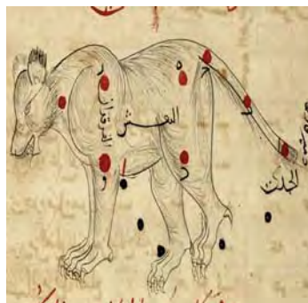
تصویر ۲۰. صورت فلکی دب، صورالکواکب، کتابخانه ملی پاریس، سده هفتم هجری، مأخذ: www.gallica.bnf.fr