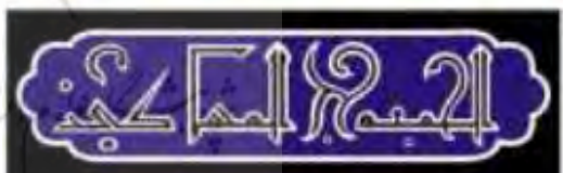
شکل ۱۰- الجمعه حج المساکین (همان: ۱۰۶).