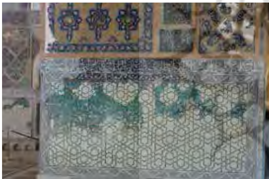
شکل ۱- آیات قرآنی در پایه‌های مسجد (نگارندگان، ۱۳۹۸)

شیوه نام‌گذاری پایه‌های مسجد بر اساس موضوعی، که آیات قرآنی در آن به کار رفته، مشخص کرده‌اند. در برخی موارد، چند کلمه نخست آیه آمده است و در برخی بر اساس مضمون آیات، نام‌گذاری انجام شده است. ۸ پایه با نامه‌ای (الف توکل، ب الحمد لله، ج سبحان الله، د رسالت، ه سلام، و توحید، ز دعا، شناخته می‌شوند و پایه هشتم، که هنوز آیات آن مشخص نیست (حسینیپور میزاب، ۱۳۸۹: ۹۸).