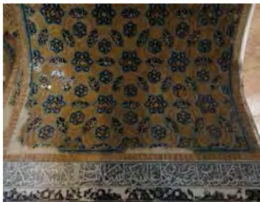
شکل ۱۱- بخشی از اسماء الهی در کتیبه های مسجد کبود (نگارندگان، ۱۳۹۸).

است. اگر خداوند چنین نام و صفاتی را برای خود در نظر نگرفته بود، شناختش غیرممکن می شد. ۱۱