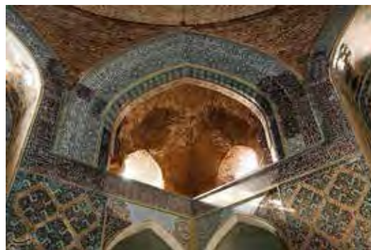
شکل ۸- بخشی از کتیبه قرآنی سوره کهف (حسینی نیا و همکاران، ۱۳۹۵: ۶).

اهمیت نماز جمعه و فلسفه آن در چند کتیبه مسجد کبود بیان شده است. در طرف گنبد خانه آیات ۹ تا ۱۱ سوره مبارکه جمعه حک شده است. دو کتیبه نیز در شان نماز جمعه از سوی پیامبر اکرم (ص) در این مسجد دیده شده است که به صورت «الجماعه رحمه الله» و «الجمعه حج المساکین»