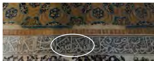
شکل ۵- قسمتی از «آیه قُلْ كَفَى بِاللَّهِ يَاطَهُ تَوَكَّلْ، سوره نساء آیه ۸۱ (نگارندگان، ۱۳۹۸).

در بعضی از نوشته‌های نسیمی این واژه قرآنی به کار رفته، که