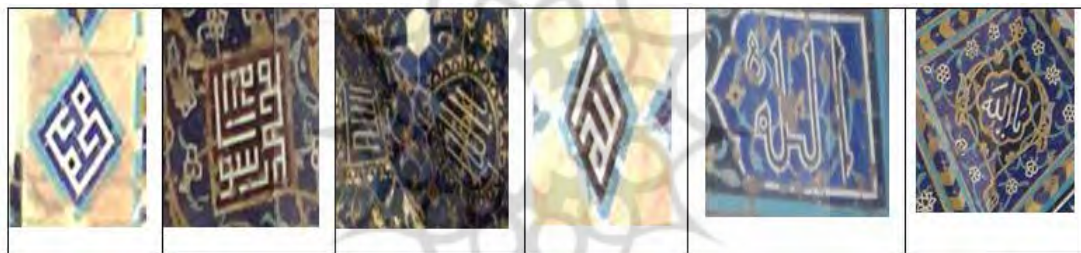
شکل ۶- انواع شکل‌های متفاوت الله و محمد (ص) در مسجد کبود (نگارندگان، ۱۳۹۸).