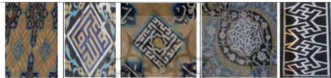
شکل ۷- انواع شکل‌های متفاوت نام حضرت (علی) در مسجد کبود (نگارندگان، ۱۳۹۸).

در بیش تر قسمت‌های این بنا، واژه‌های یا علی، علی (ع) و علی همراه با الله و محمد (ص) دیده می‌شود. بعضی از واژه‌ها با خط ثلث و ترکیب با واژه «یا علی» و در بعضی واژه‌های دیگر با خط کوفی بنایی نوشته شده است. ذکر واژه علی بیش تر در قسمت سردر ورودی و روی پایه‌ها و زیر طاق نما نگاشته شده است (شکل ۷).