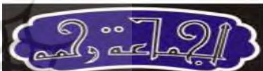
شکل ۹- واژه الجماعه (نعمتی بابای لو و مطمئن، ۱۳۹۸: ۱۰۶).