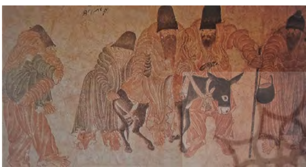
تصویر ۶. محمد سیاه قلم، هرات.

– تکرار: از عناصر اساسی در نگارگری ایران می‌توان به خط