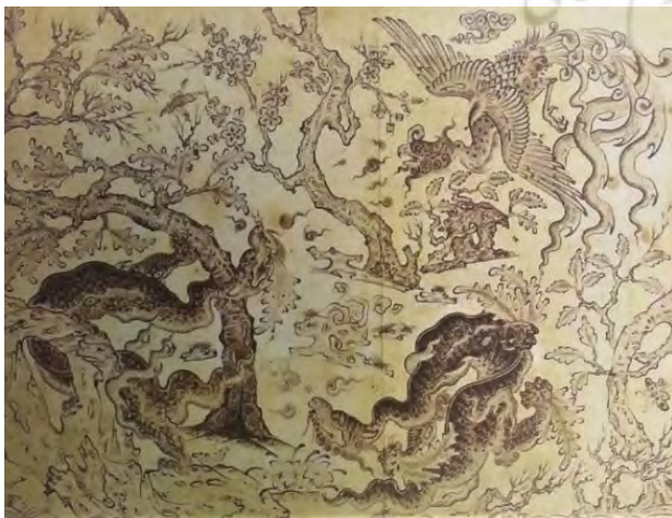
تصویر ۵. محمد سیاه قلم، هرات. مأخذ: آژند، ۱۳۹۲، ۳۵۶.

وام گرفته شده باشد (O. Kane, 2003, 5) با توجه به اینکه دربارهٔ هویت «محمد سیاه قلم» و آثار او آرای متفاوتی وجود دارد، گاهی برای آثار او منشأ چینی قائل شده و زمانی آنها را جلوه‌ای از زندگی ایلات و عشایر آسیای میانه و آیین‌های شمنی دانسته‌اند (تصویر ۳).