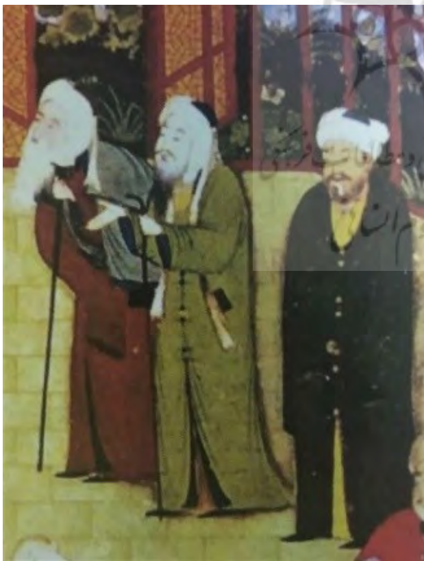
تصویر ۷. بخشی از اثر، کمال‌الدین بهزاد، هرات. مأخذ: آژند، ۱۳۹۲، ۳۱۴.