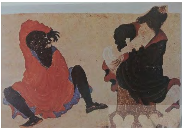
تصویر ۳. محمد سیاه قلم، هرات.

به پروازند. اینجا طبیعت وحش با حیوان وحشی در هم تنیده شده و فضایی سوررئال پدیدار ساخته است. این نوع فضای سوررئال را می‌توان در یک اثر سیاه قلم دیگر استاد محمد سیاه قلم مشاهده کرد. در این نگاه گرفت‌وگیر سیمرغ و اژدها در لابه‌لای درختان شکوفان و پرشاخ‌وبرگ فضا سازی