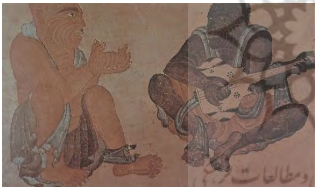
تصویر ۴. محمد سیاه قلم، هرات. مأخذ: همان، ۱۴۹.