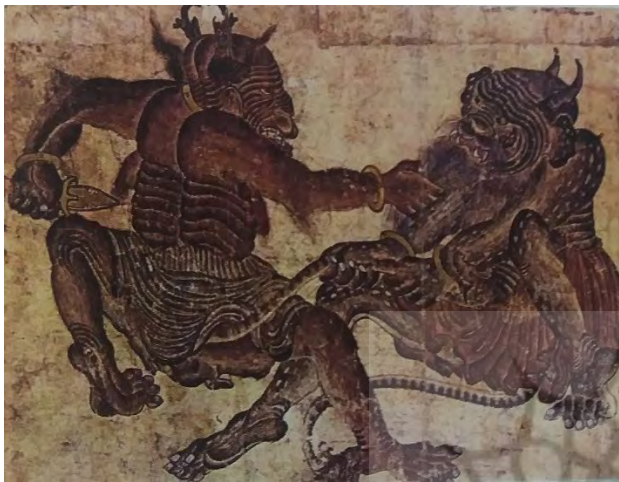
تصویر ۱. محمد سیاه قلم، هرات.

همگان قرار نگرفته است، اما همگان بر آن اند که این آثار کار یک نفر هنرمند مسلمان است (همان). همچنین این آثار در عین شباهتی که به نقاشی چینی دارند، چینی نیستند. به عنوان مثال در نگارگری ایران نشان دادن دندانها کمتر ممکن است به چشم بخورد، در حالی که در آثار «محمد سیاه قلم» این مورد دیده می شود، که شاید از نقاشی چینی