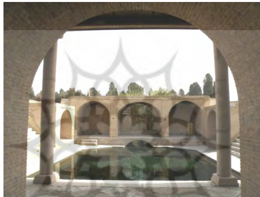
نمای شمالی چشمه سلیمانیه، خروج آب از حوضخانه