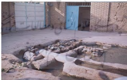
لت حسن آباد اولین لت در دشت دروازه‌فین

پس از گذشتن از چهار تقسیمگاه، در دسترس کشاورزان قرار می‌گیرد که به ترتیب موقعیت عبارت‌اند از: لت آرزو، لت صدری، لت سرمیدان و لت لباده. از ویژگی‌های لت‌های این دشت این است که از هر لت، نه جوب به یک اندازه و همسان منشعب می‌شوند. منظور از همسانی جوب‌ها یکنواختی مدخل جوب یا منفذهای خروجی آب یا اصطلاحاً «بره» (bare) از لت است که در کف و جناحین جوب‌ها، تخته‌سنگ‌هایی هم‌اندازه نصب شده‌اند تا این منفذها هم‌اندازه و غیرقابل تغییر شوند. در این دشت امکان دارد یک کشاورز نه جوب آب داشته باشد که در این صورت، نه جوب یا بره را باز می‌کند؛ اما اگر پنج جوب داشته باشد، پنج جوب را به سمت اراضی خود هدایت می‌کند و چهار جوب دیگر را برای بهره‌برداری کشاورزان دیگر به تقسیمگاه بعدی می‌فرستد یا هم‌آب‌هایش در همان تقسیمگاه بهره‌برداری می‌کنند. بنابراین نه جوب آبی که وارد دشت می‌شود به همان نه جوب تقسیم می‌شود که این تقسیم تا لت آخری (لباده) ادامه می‌یابد و هر کشاورز هر چند جویی که در هر لت مالک باشد، می‌تواند بهره‌برداری کند. به هر شکل، صبح پنجشنبه آب نخست به لت آرزو می‌رسد و آبخورهایی که اراضی‌شان با این لت مشروب می‌شود، بنابر نوبت و میزان سهمشان، بره‌های لت را می‌گشایند و آب را به جویی که به ملکشان ختم می‌شود، هدایت می‌کنند. در غیر این صورت، بره‌ها را برای لت‌های پایین دست باز می‌گذارند. گفتنی است فاصله زمانی رسیدن آب از لت آهنی فین تا دشت دروازه‌فین، دو ساعت طول می‌کشد که این دو ساعت در شب که آب را می‌بندند، جبران می‌شود. بدین صورت که پس از بستن جوب در لت آهنی، انتهای آبراهه جوب پس از دو ساعت به دروازه‌فین می‌رسد.