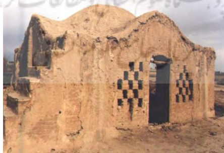
اتاق سرجه‌پیما در دشت دروازه‌فین، مکان تقسیم آب با سرجه

آب چشمه سلیمانیه به یازده قسمت مساوی تقسیم می‌شود که به هر قسمت، یک جوی یا جوب می‌گویند. در عرف محل، هر جوب به انضمام دو دانگ آب «قنات تنبلی» معادل شش