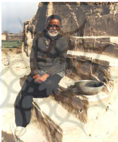
سرجه‌پیما، تقسیم آب با سرجه

خانواده‌هایی با نام سرجه‌پیما شناخته می‌شوند که می‌گویند چون شغلشان سرجه‌پیمایی بوده، به این نام شهرت دارند. به هر حال، سرجه‌پیما در اتاکی که هنوز بنای آن در دشت دروازه‌فین به همین نام باقی مانده، می‌نشست و لگنی از آب تمیز و شفاف را در جلو خود می‌گذاشت و تعدادی سنگریزه به تعداد سرجه‌پیما به میزان تعداد سرجه یک طاق (۷۵ سرجه) در کنارش قرار می‌داد و در حضور تعدادی از آبیاران، سرجه را روی آب لگن می‌گذاشت و مدت ده دقیقه و سی ثانیه منتظر می‌نشستند تا سرجه پر شده به ته لگن غوطه‌ور شود. به محض پر شدن، سرجه را از آب بیرون آورده، یک عدد از سنگریزه‌ها را به نشانه یک سرجه کنار می‌گذاشت. این کار تا آخر طاق تکرار می‌شد. میراب شخص دیگری است که در کنار سرجه‌پیما، بر تقسیم آب نظارت داشته است؛ به طوری که هیچ کشاورزی اجازه ندارد بدون اجازه او آب را ببندد یا باز کند.