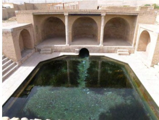
نمای جنوبی چشمه سلیمانیه، ورود آب به حوضخانه