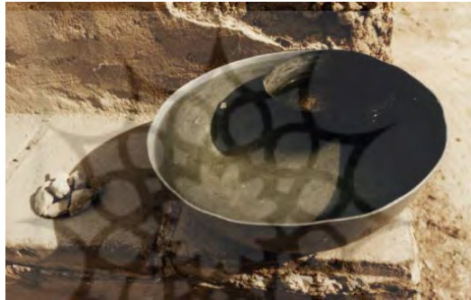
نحوه به‌کارگیری سرجه در تقسیم آب

را در طول شبانه‌روز و طاق و نیم‌طاق به‌طور مساوی تقسیم کنند، از نوعی زمان‌سنج آبی به نام «سرجه» (sereje) استفاده می‌شده است. برای این کار، ظرفی نسبتاً بزرگ از جنس مس به نام لگن را از آب پر کرده، سرجه را روی آب می‌گذاشتند. ته سرجه روزنه‌ای ریز و تنگ داشته که به تدریج آب از سوراخ وارد سرجه می‌شد و به محض پر شدن سرجه به ته لگن غوطه‌ور می‌شد. مدت‌زمان پر شدن سرجه را یک واحد زمانی به نام «سره» (sere) معادل نه دقیقه و سی ثانیه محسوب می‌کنند. از آنجا که امکان داشته برخی از کشاورزان در یک شبانه‌روز یا یک طاق، کمتر از یک سره آب داشته باشند، سرجه را با خط‌گذاری به چهار قسمت تقسیم می‌کرده‌اند که هر قسمت معادل یک‌ونیم دانگ برابر دو دقیقه و سی ثانیه و یک سرجه کامل معادل شش دانگ آب به حساب می‌آورده‌اند.