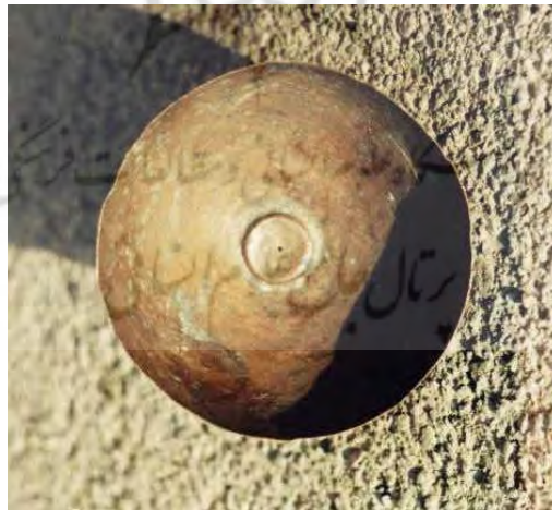
سرجه از جنی مس، وسیله تقسیم آب

به کسی که آب را با سرجه تقسیم می‌کرد، «سرجه‌پیما» می‌گفتند. اهمیت و نقشی که سرجه در گذشته در تقسیم آب داشته، باعث پیدایش شغلی به نام سرجه‌پیما شده بود. در کاشان