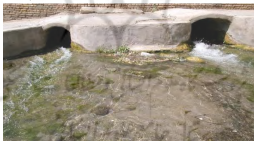
لت ناصری، آب به چهار قسمت تقسیم می‌شود.

برای اینکه آب را با مدار صحیحی بین باغات و مزارع تقسیم کنند، از مظهر آب تا دشت حسن آباد در مسیر آب، چند لت یا تقسیمگاه زده شده است. اولین تقسیمگاه بدون فاصله بعد از مظهر آب، در محل چشمه و در پشت باغ تاریخی فین واقع است که به تقسیمگاه یا لت «ناصری» (latenâser) معروف است. در این تقسیمگاه، آب به چهار قسمت تقسیم می‌شود: یک جوب شش‌دانگی در ضلع غربی لت موسوم به دوش خلوت ۱ که پس از گذشتن از حیاط چند