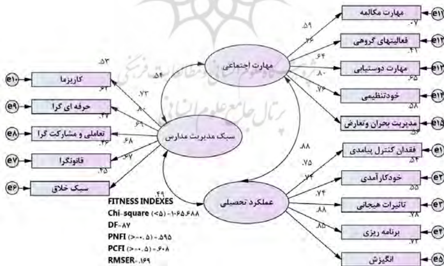
شکل ۱: الگوی تحلیلی پژوهش با در نظر گرفتن تمامی متغیرهای پنهان

طبق اطلاعات جدول (۱) رابطه بین سبک‌های مدیریت کلاس معلمان و مهارت‌های اجتماعی و عملکرد تحصیلی دانش‌آموزان در سطح (p=۰/۰۰۱) ، معنی‌دار است؛ بنابراین متغیر سبک‌های مدیریت کلاس معلمان به‌طور مستقیم بر عملکرد تحصیلی دانش‌آموزان و عملکرد تحصیلی دانش‌آموزان تأثیرگذار بوده و این تأثیر متقابل است.